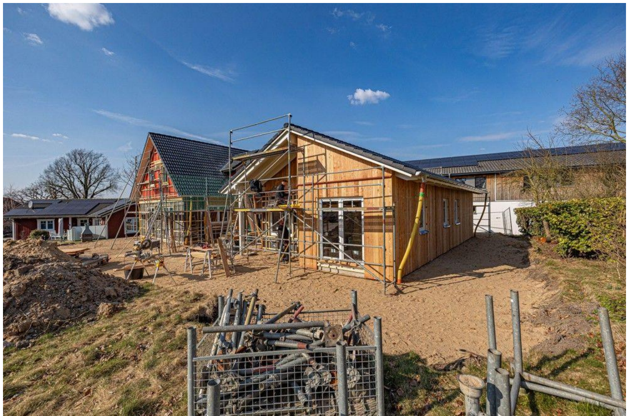
Seitenansicht rechts 2