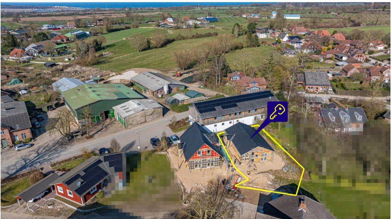
Von Oben 2