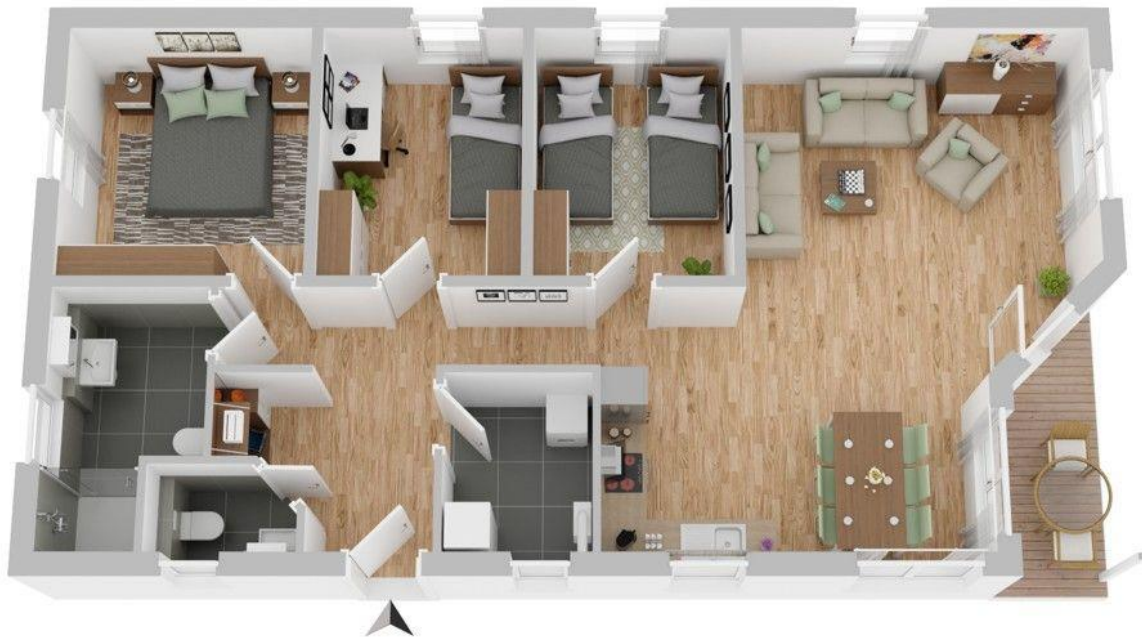
Grundriss Bungalow (nicht maßstabsgetreu)