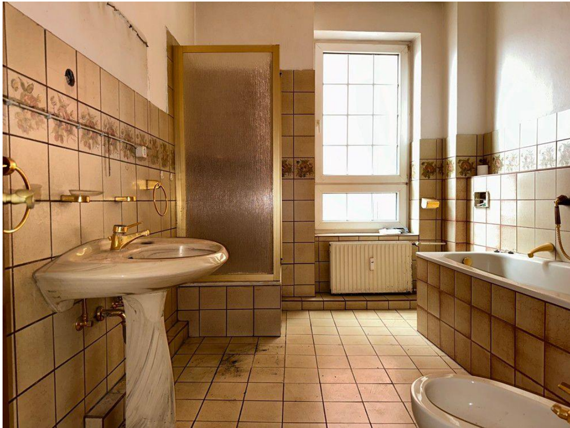
Dusch- und Wannenbad