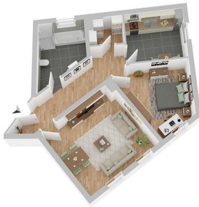
Grundriss (nicht maßstabsgetreu)