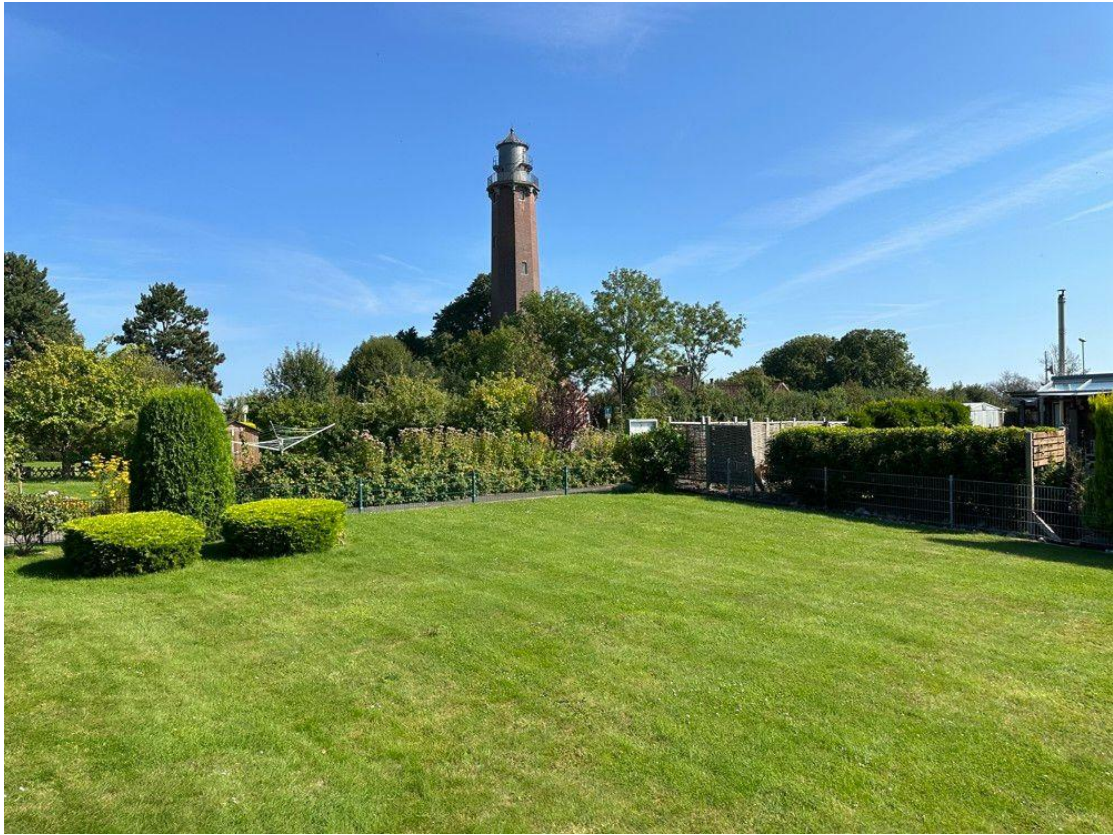
Garten mit Blick auf den Leuchtturm