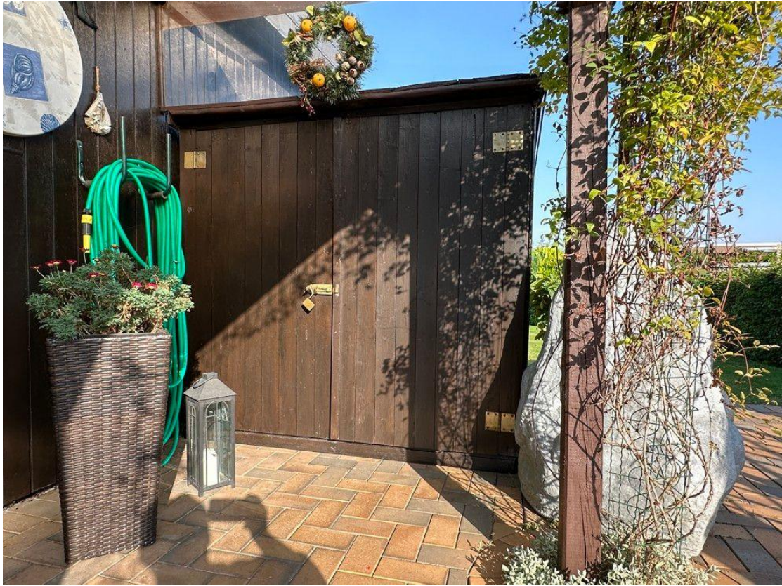
Kleiner Schuppen neben dem Hauseingang