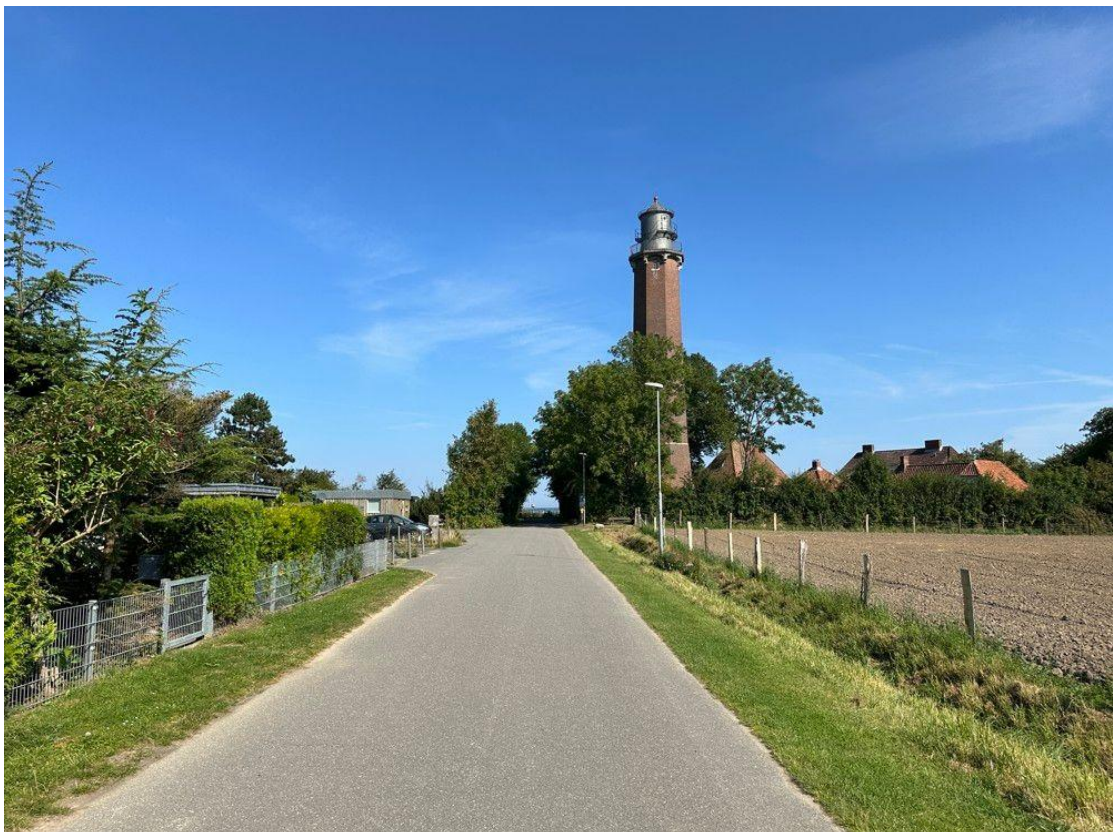
Weg zum Leuchtturm und Strand