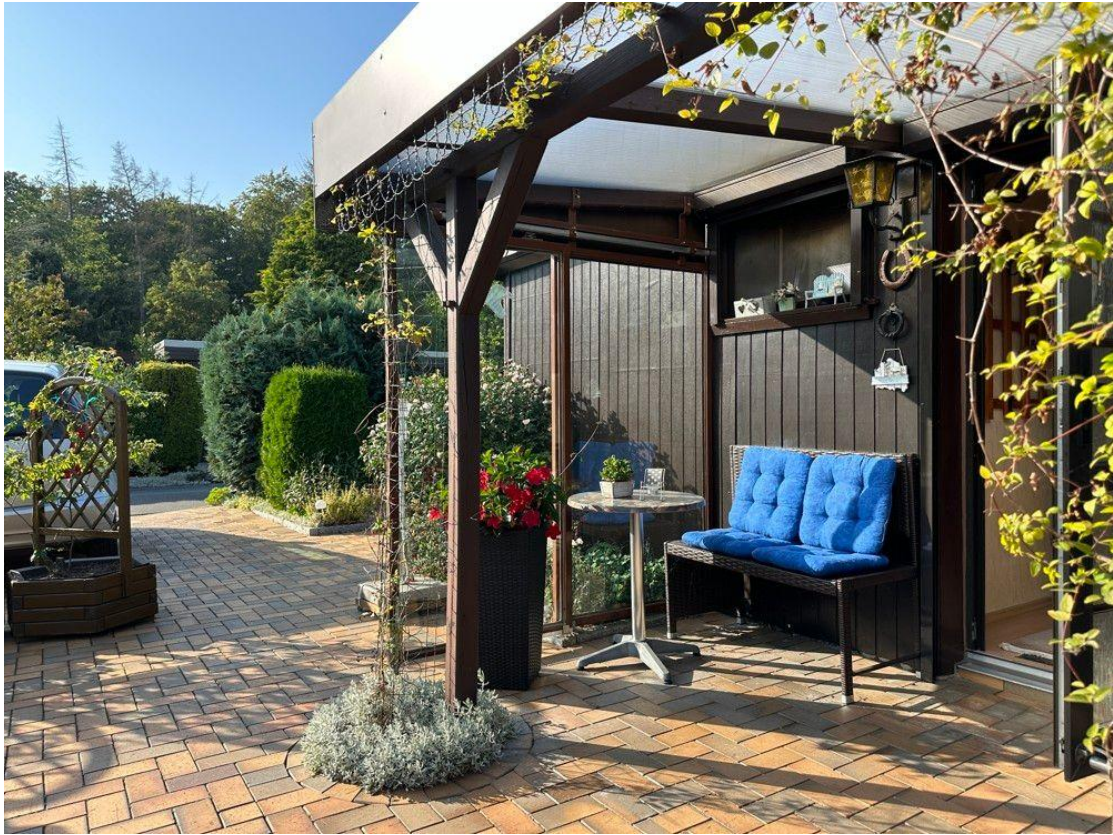
Geschütztes Plätzchen vor dem Haus