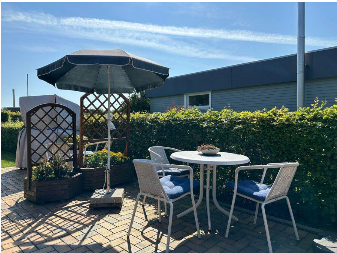
Terrasse vor dem Hauseingang