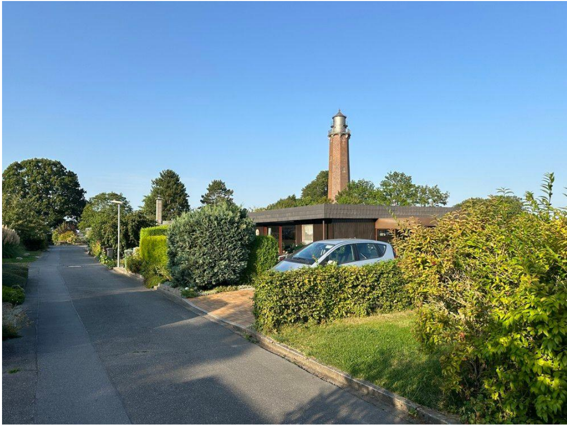
Willkommen in Behrendorf