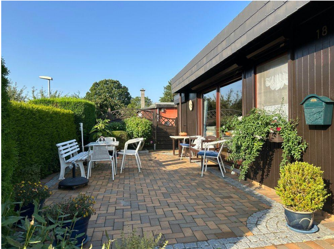
Terrasse vor dem Wohnzimmer