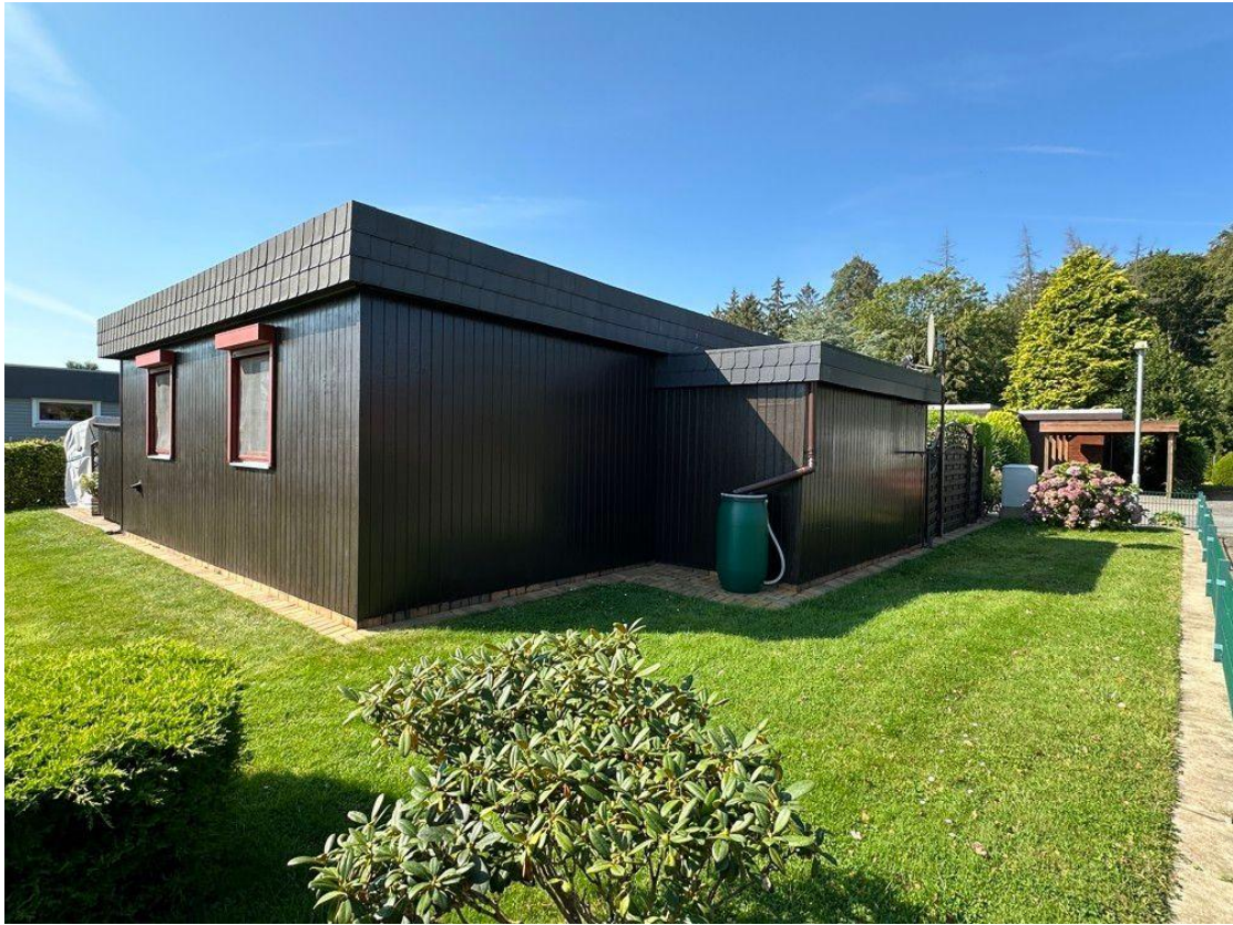
Haus mit Schuppen