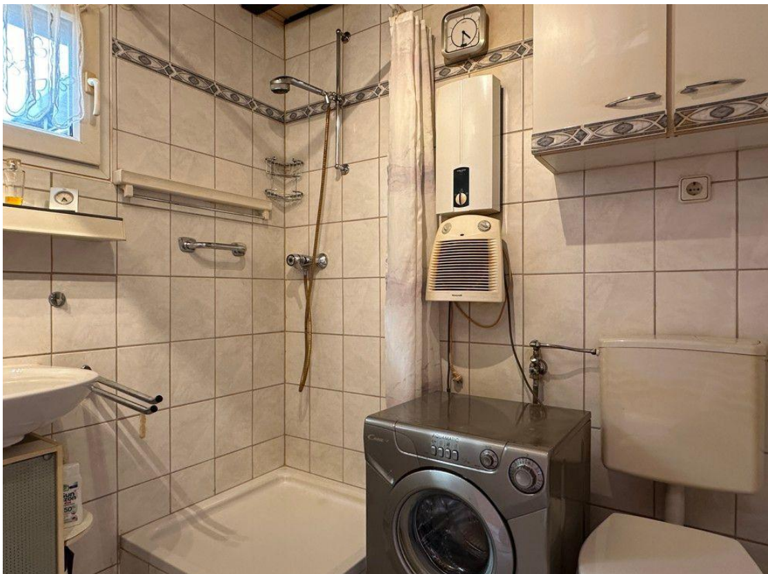
Duschbad mit Platz für eine kleine Waschmaschine