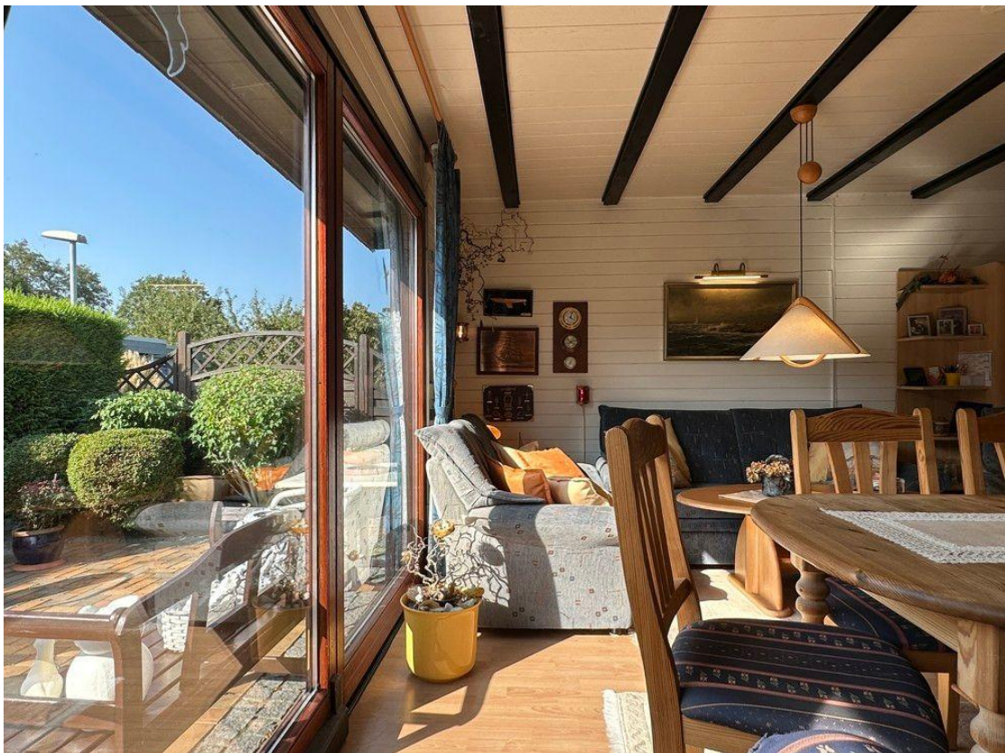
Viel Licht durch große Fensterfront