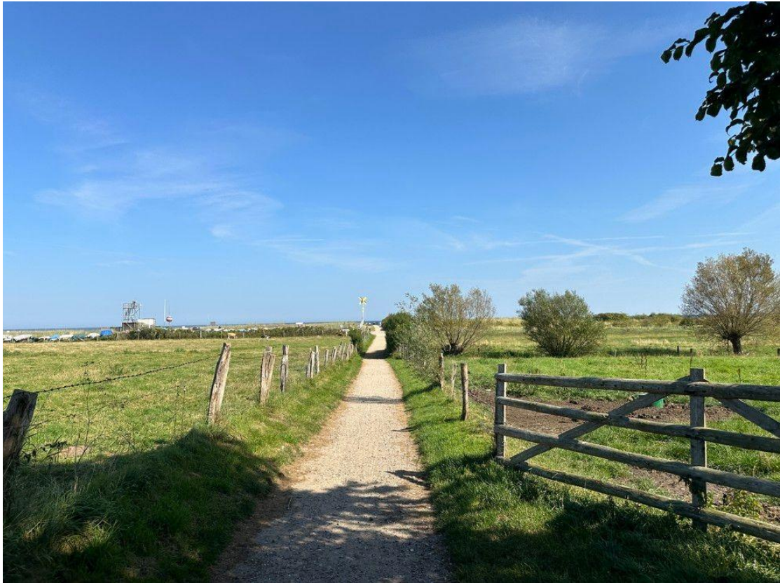
Schnell an der Ostsee