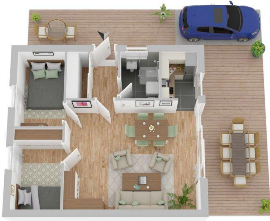
Grundriss (nicht maßstabsgetreu)