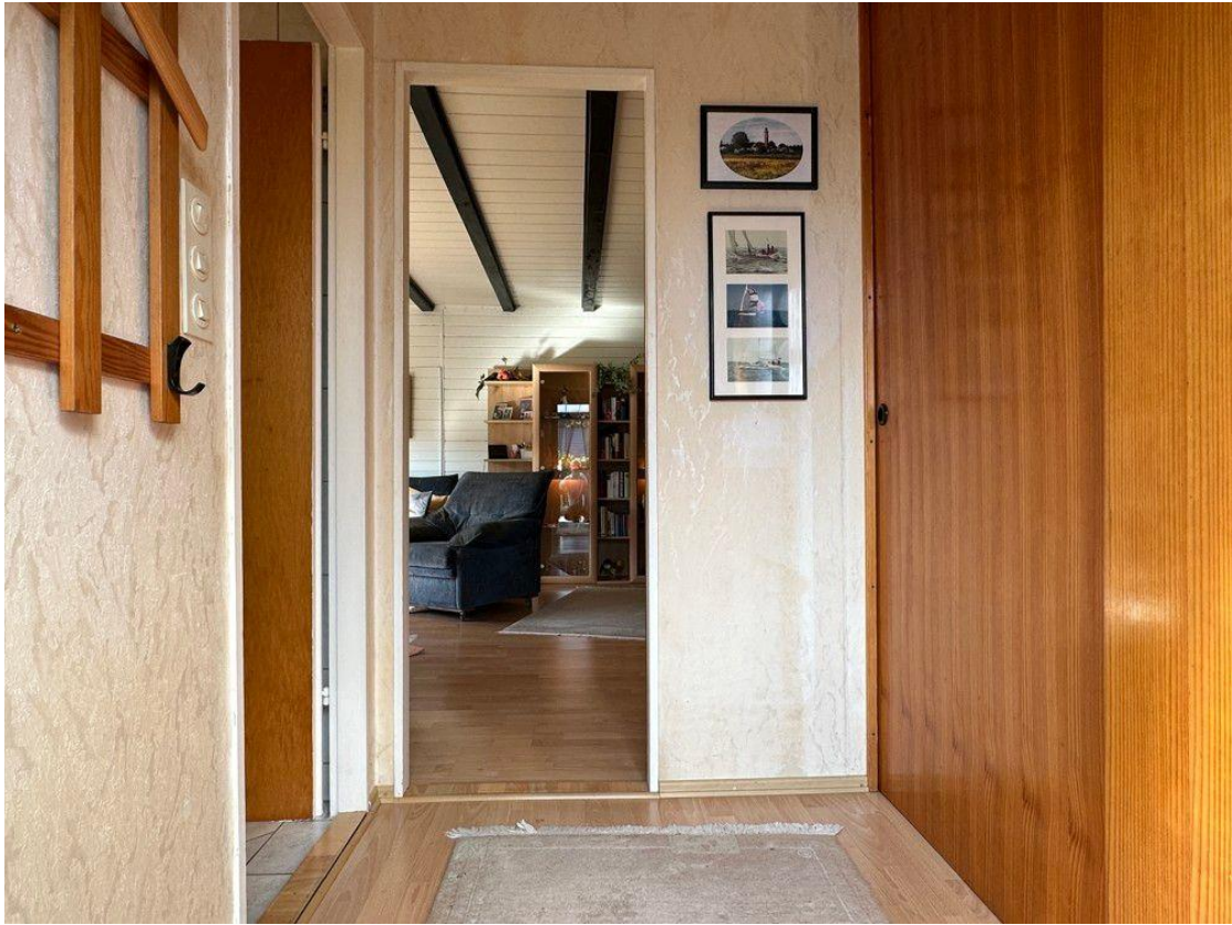
Flur mit großem Einbauschränk