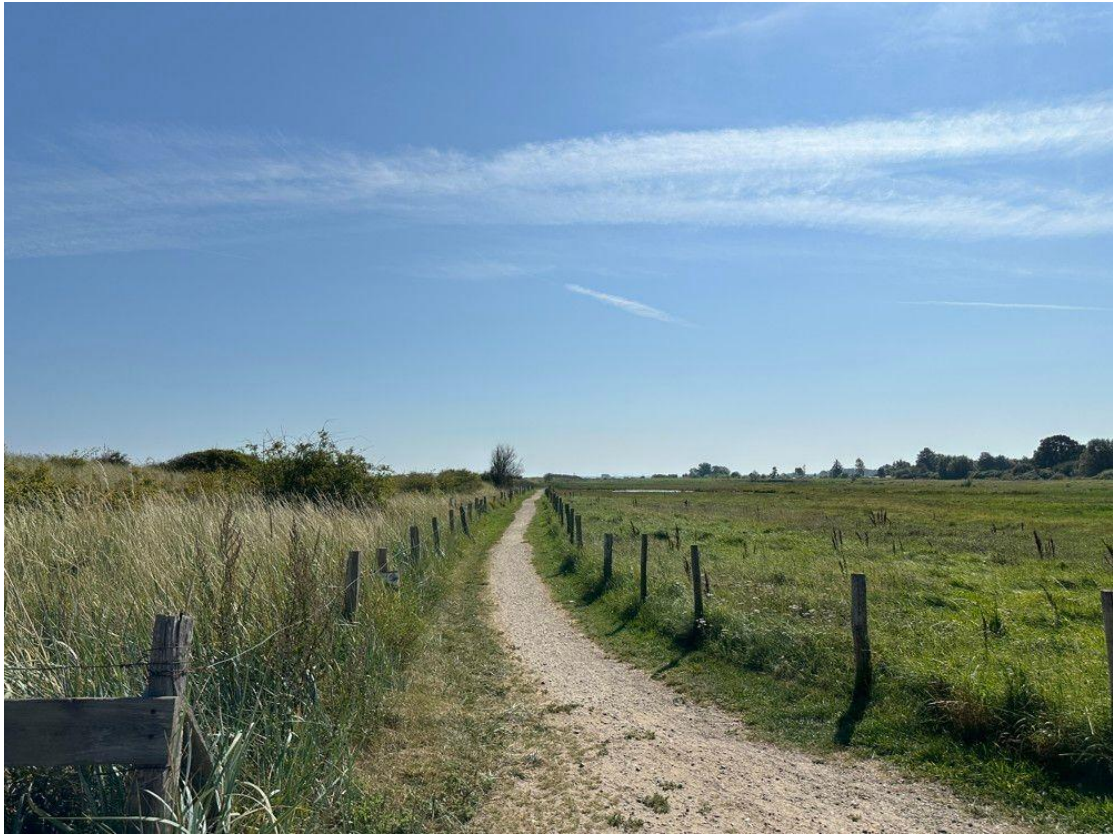
Rad- und Wanderweg