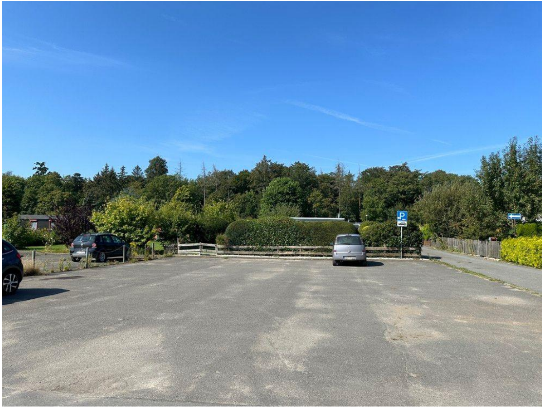
Parkplatz in der Nähe