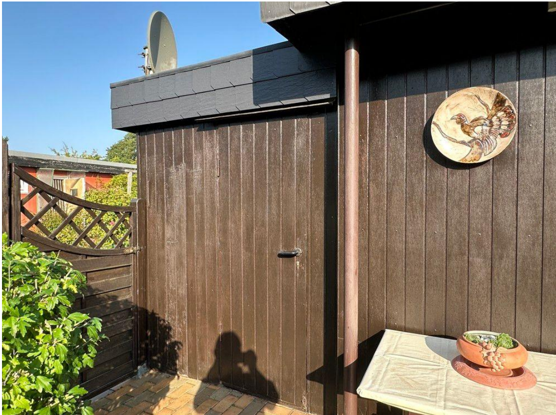
Schuppen am Haus