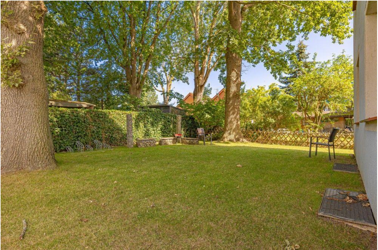
Hinter dem Haus