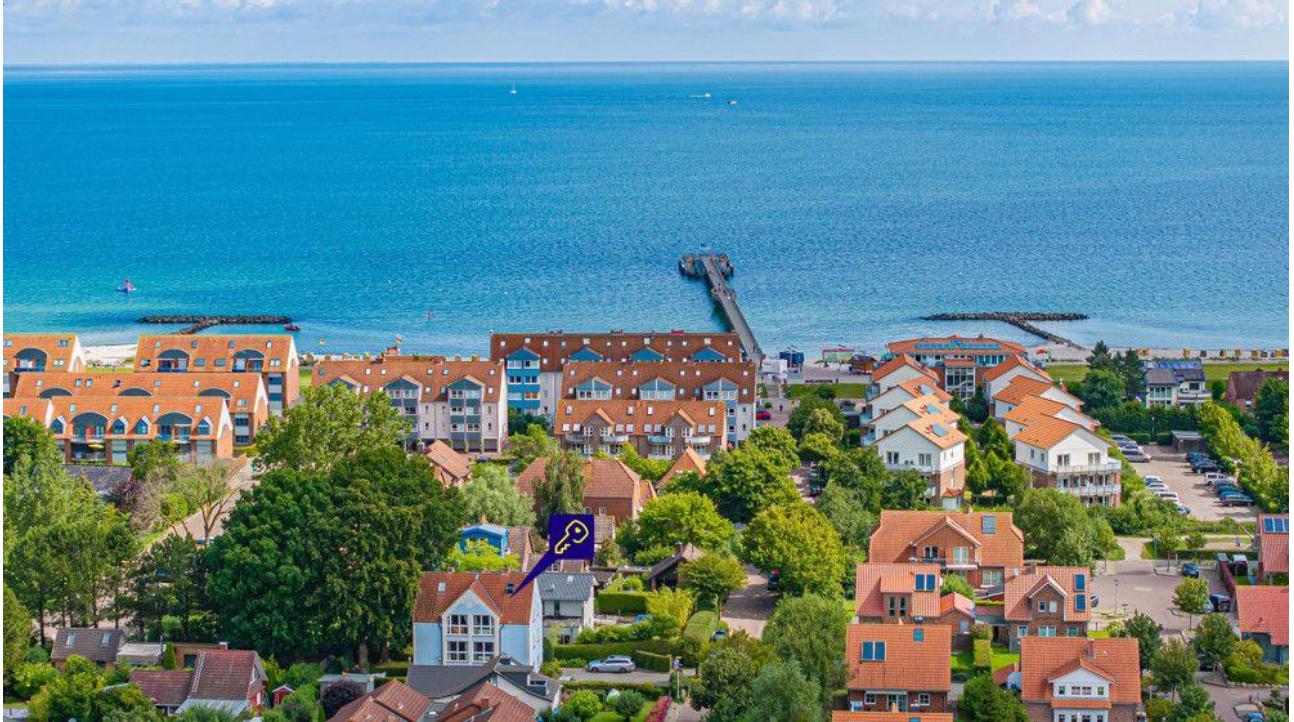
Der Ostsee so nah