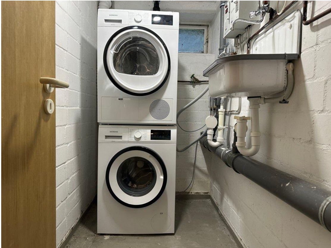
Waschmaschine und Trockner (Gemeinschaft)