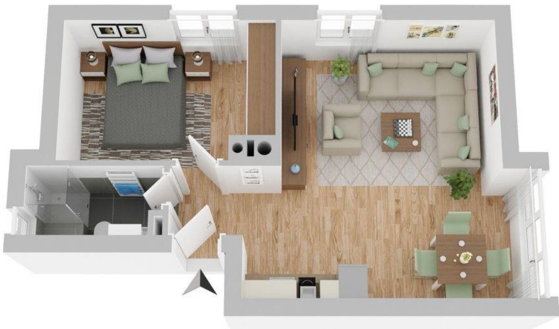
Grundriss (nicht maßstabsgetreu)