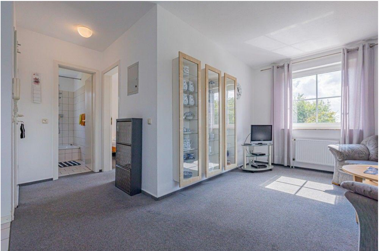
Hell und freundlich