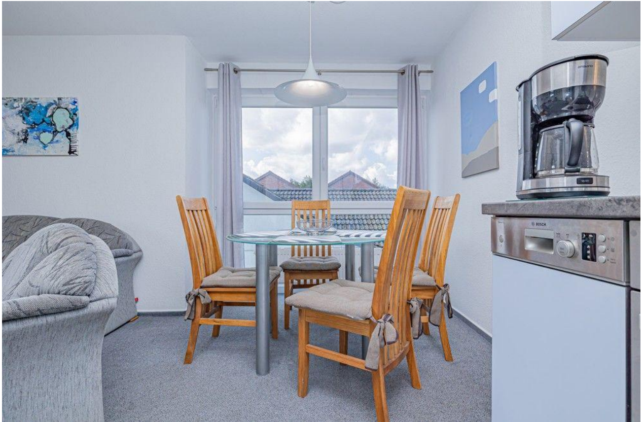
Essplatz neben der Küchenzeile