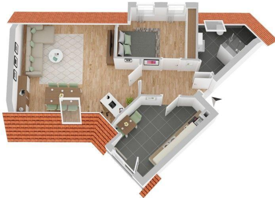
Grundriss (nicht maßstabsgetreu)