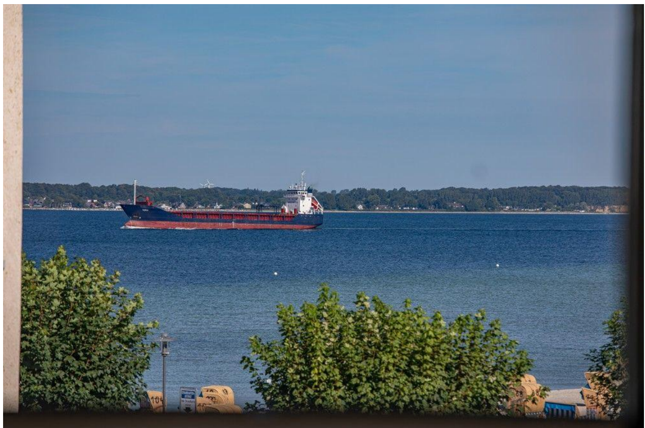
Blick aufs Meer