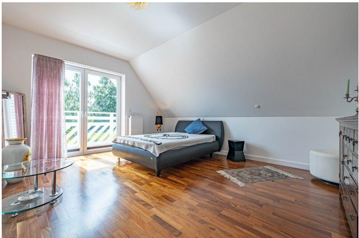
Schlafzimmer mit Balkonzugang