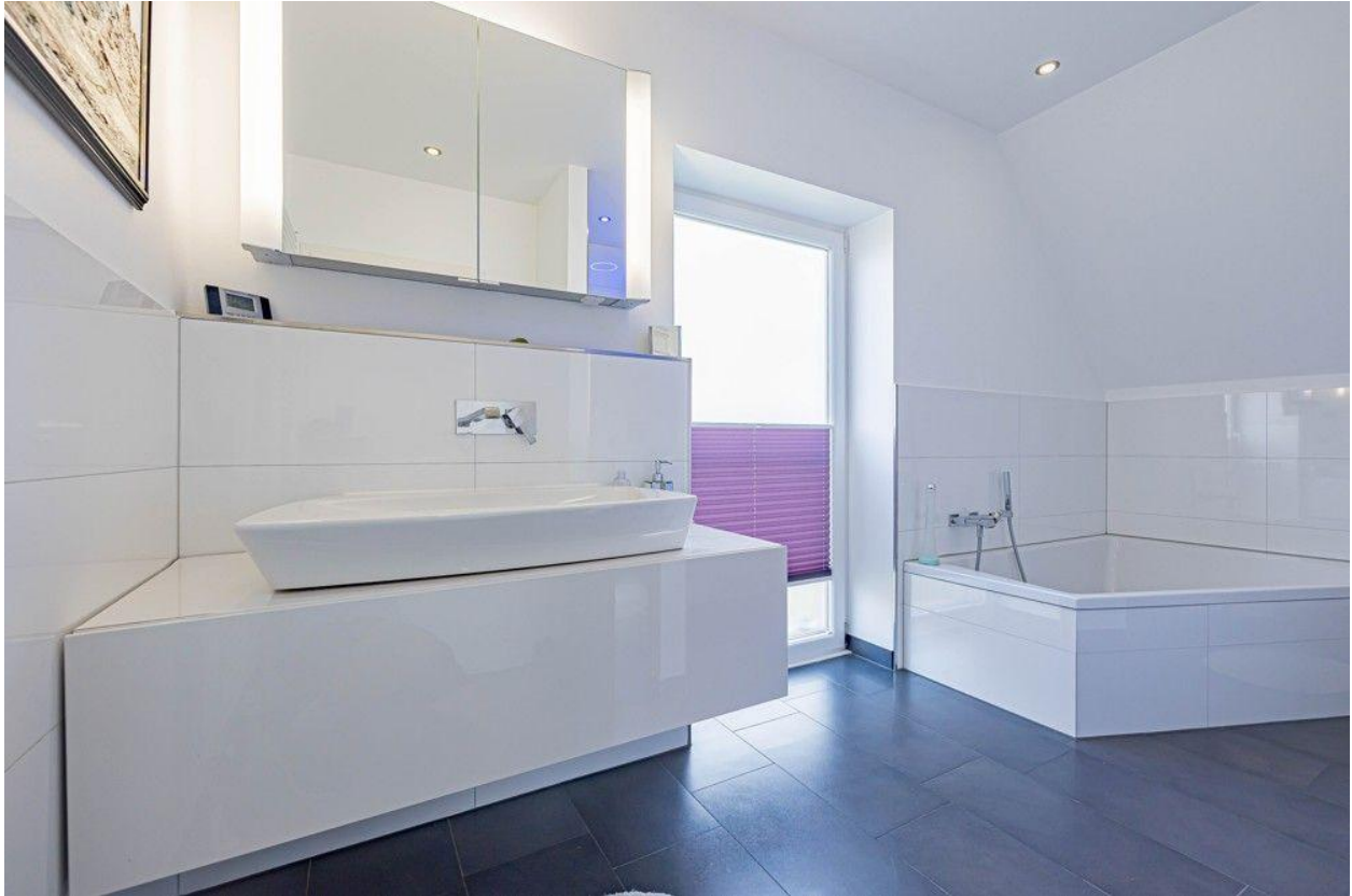
Dusch- und Wannenbad