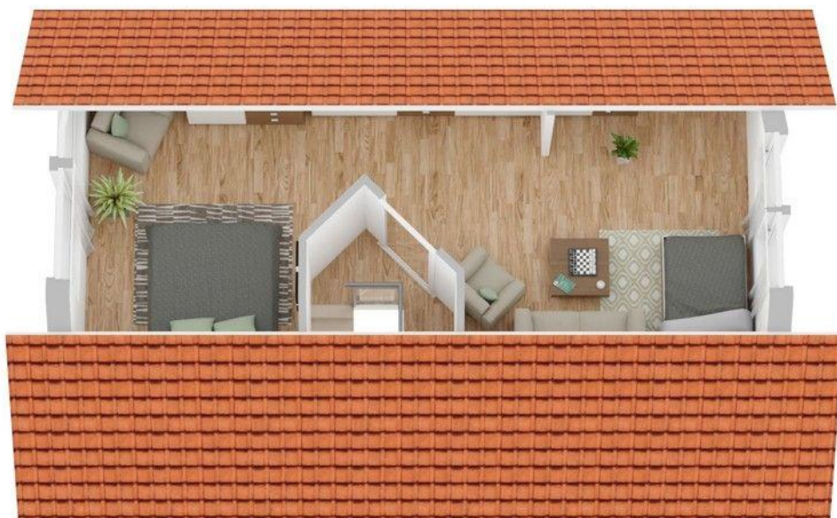
Grundriss Dachgeschoss (nicht maßstabsgetreu)