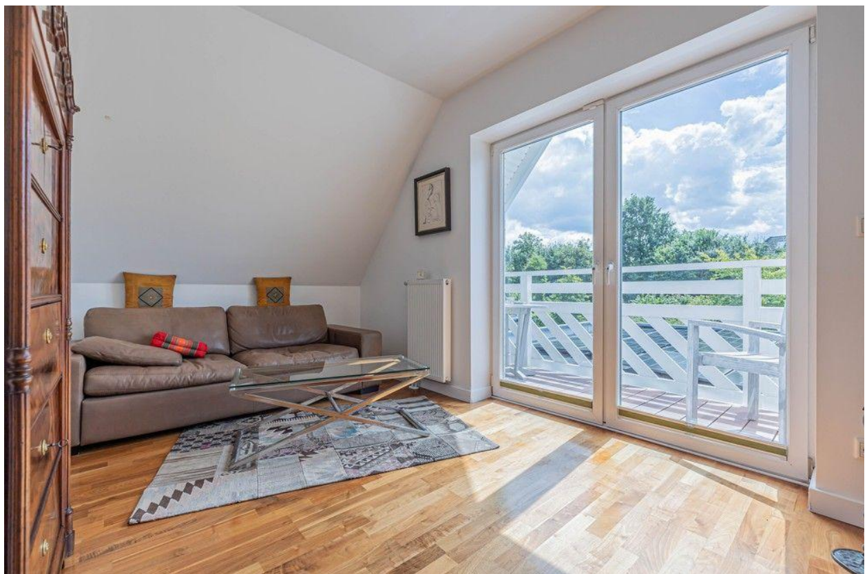
Weiteres Zimmer mit Balkonzugang