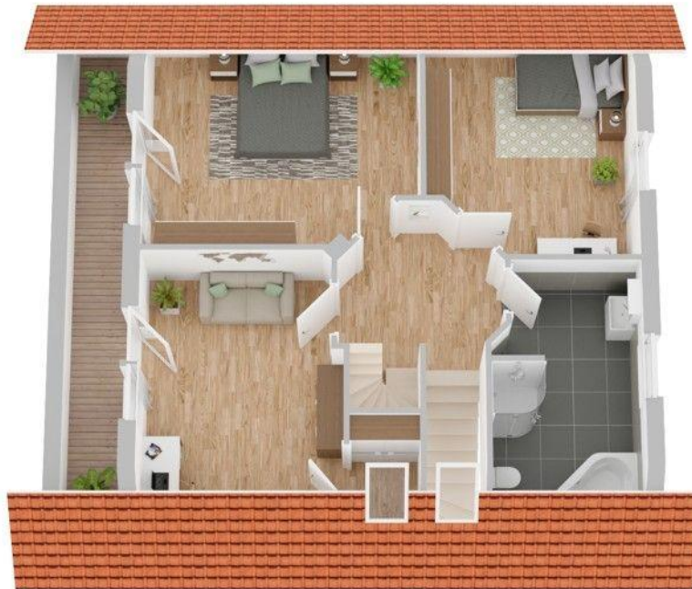
Grundriss Obergeschoss (nicht maßstabsgetreu)