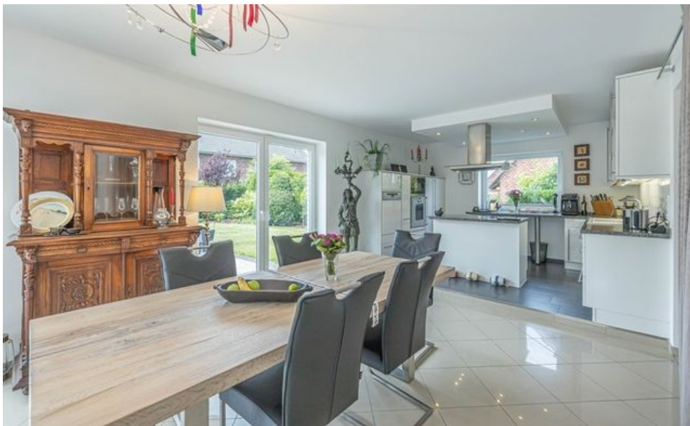
Hell und freundlich