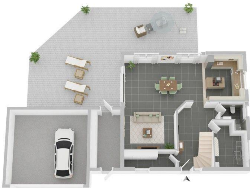
Grundriss Erdgeschoss (nicht maßstabsgetreu)