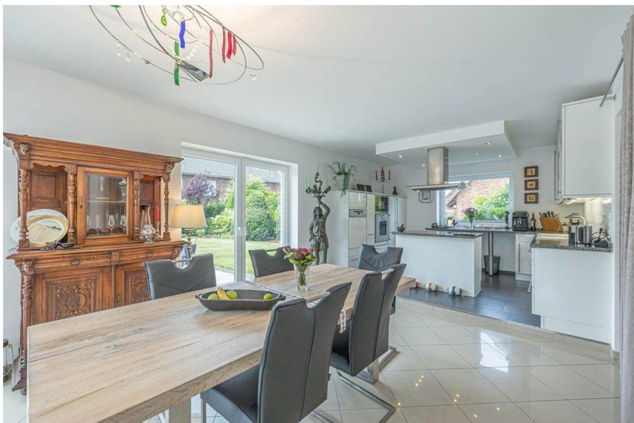
Hell und freundlich