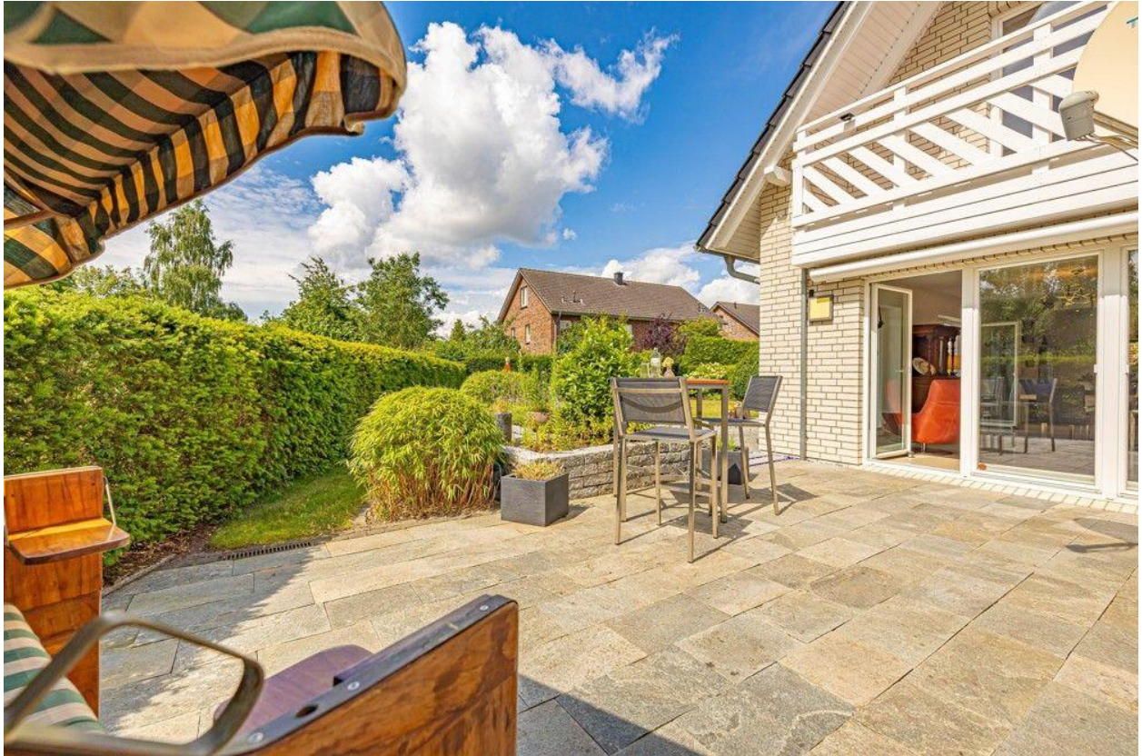
Ihr neuer Lieblingsplatz