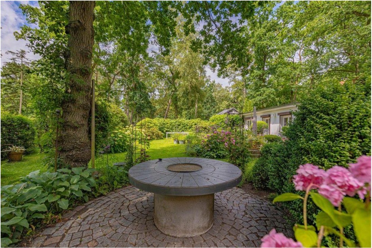
Steintisch mit Grill in der Mitte