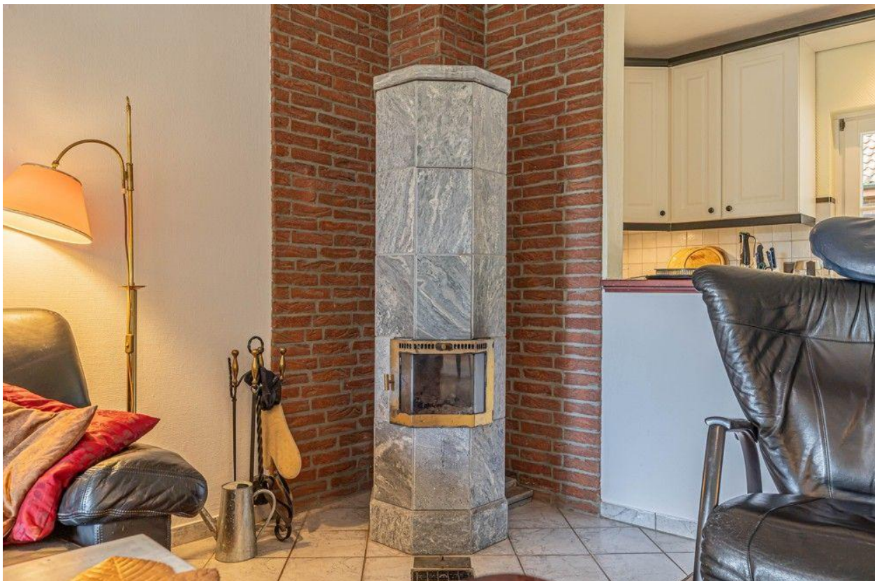
Gemütlichkeit am Specksteinofen