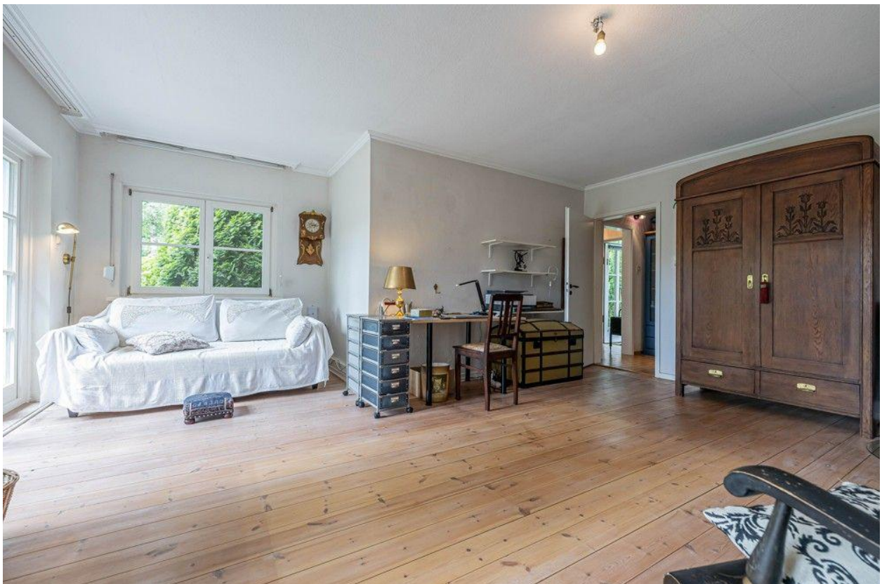
Großzügiges Zimmer mit schönen Holzdielen