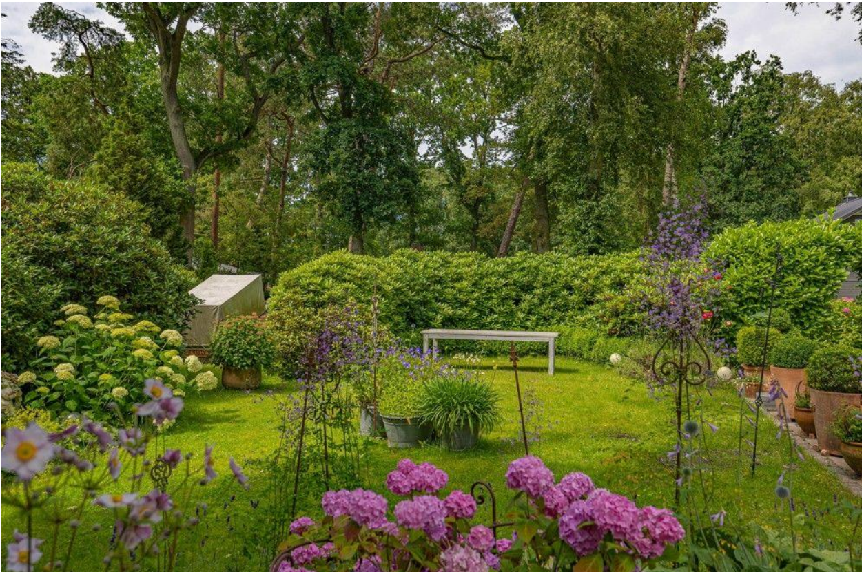
Der wunderschöne Garten