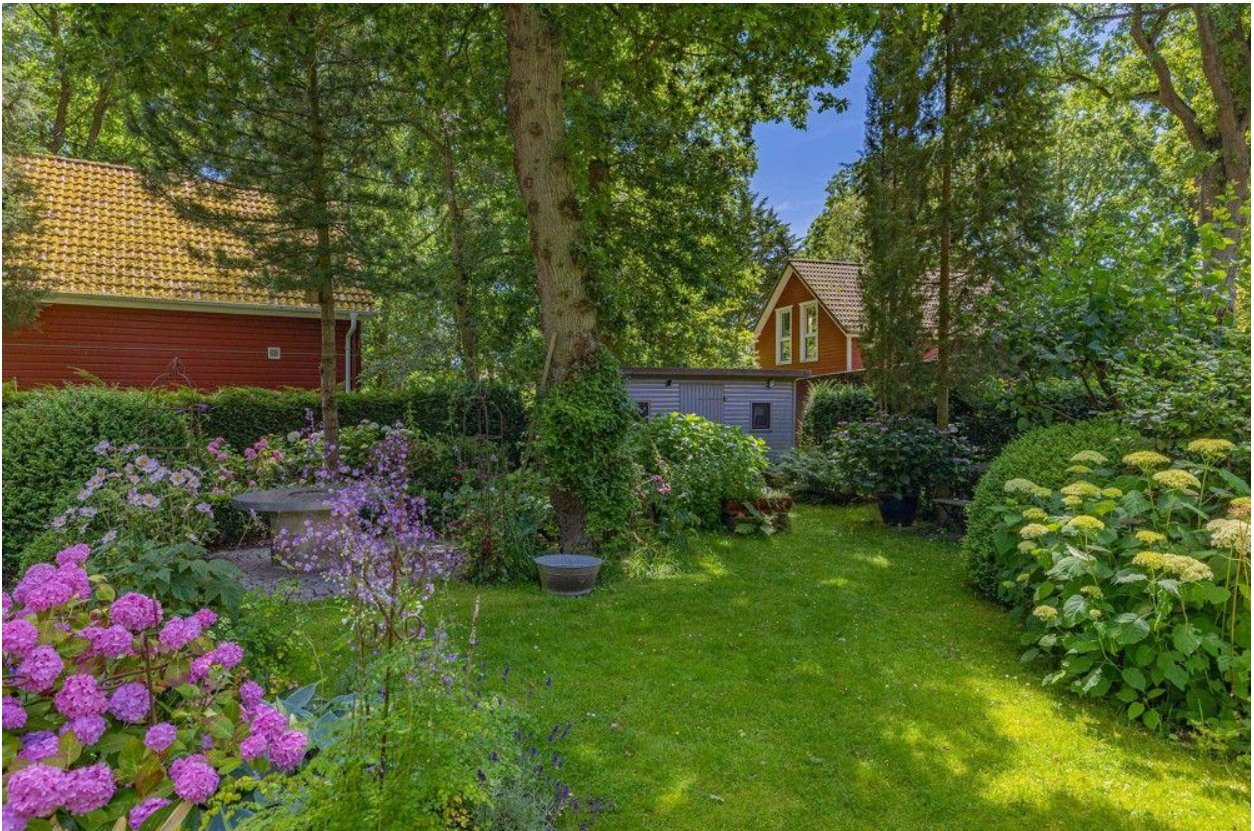
Gartenhaus in einer Ecke des Gartens