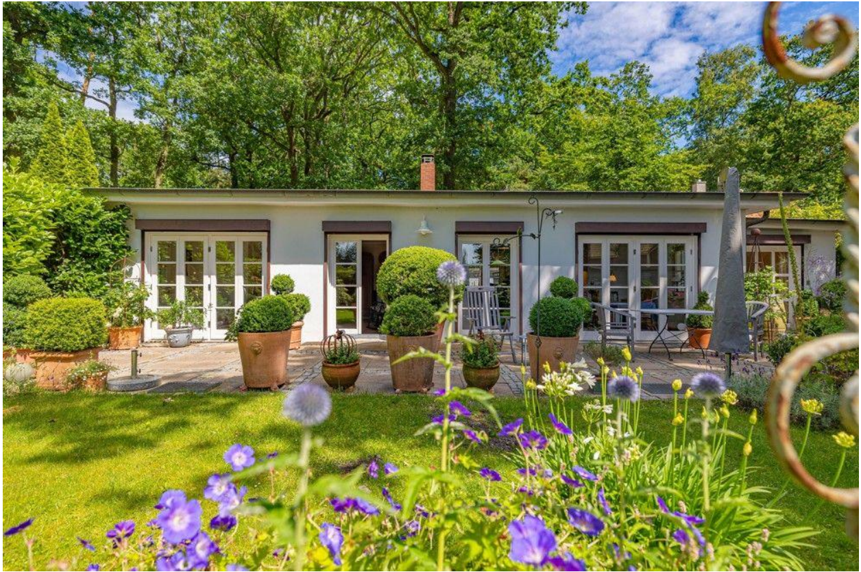
Alles auf einer Ebene