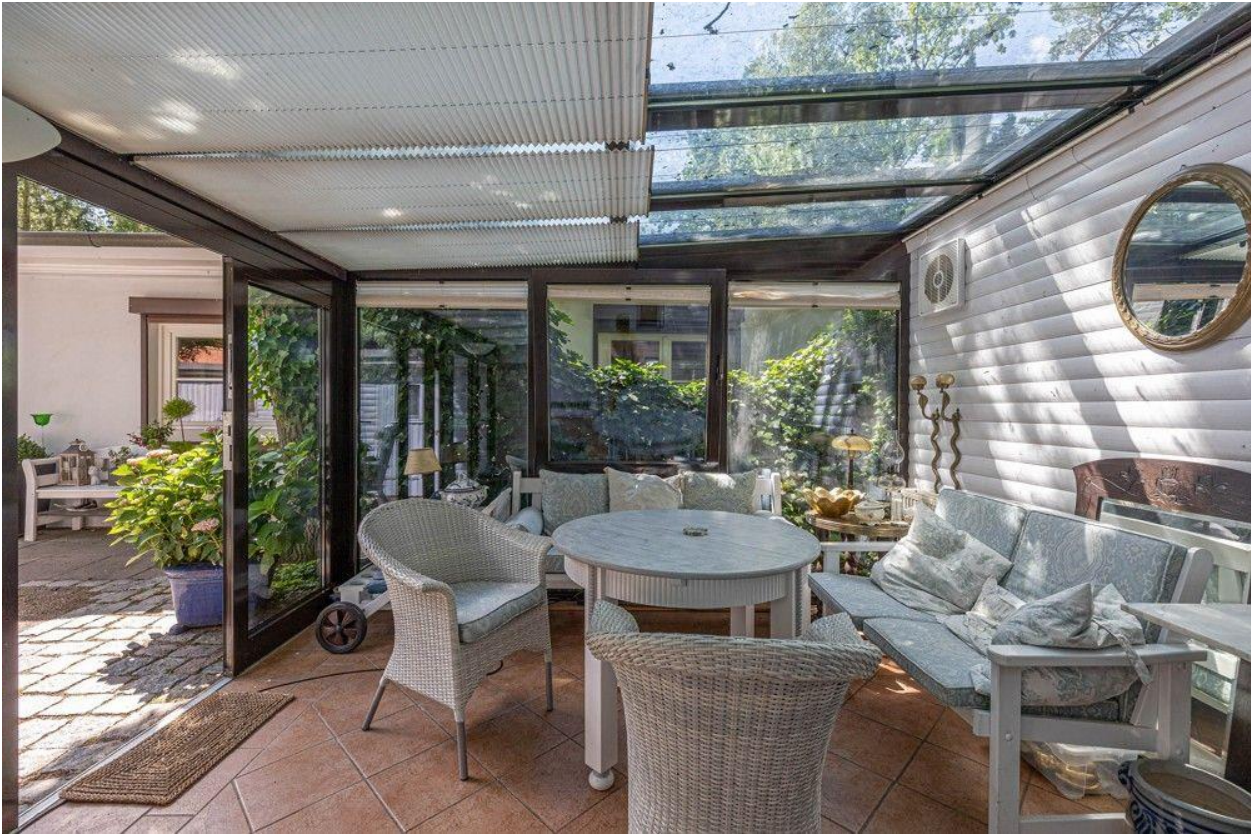
Nehmen Sie Platz