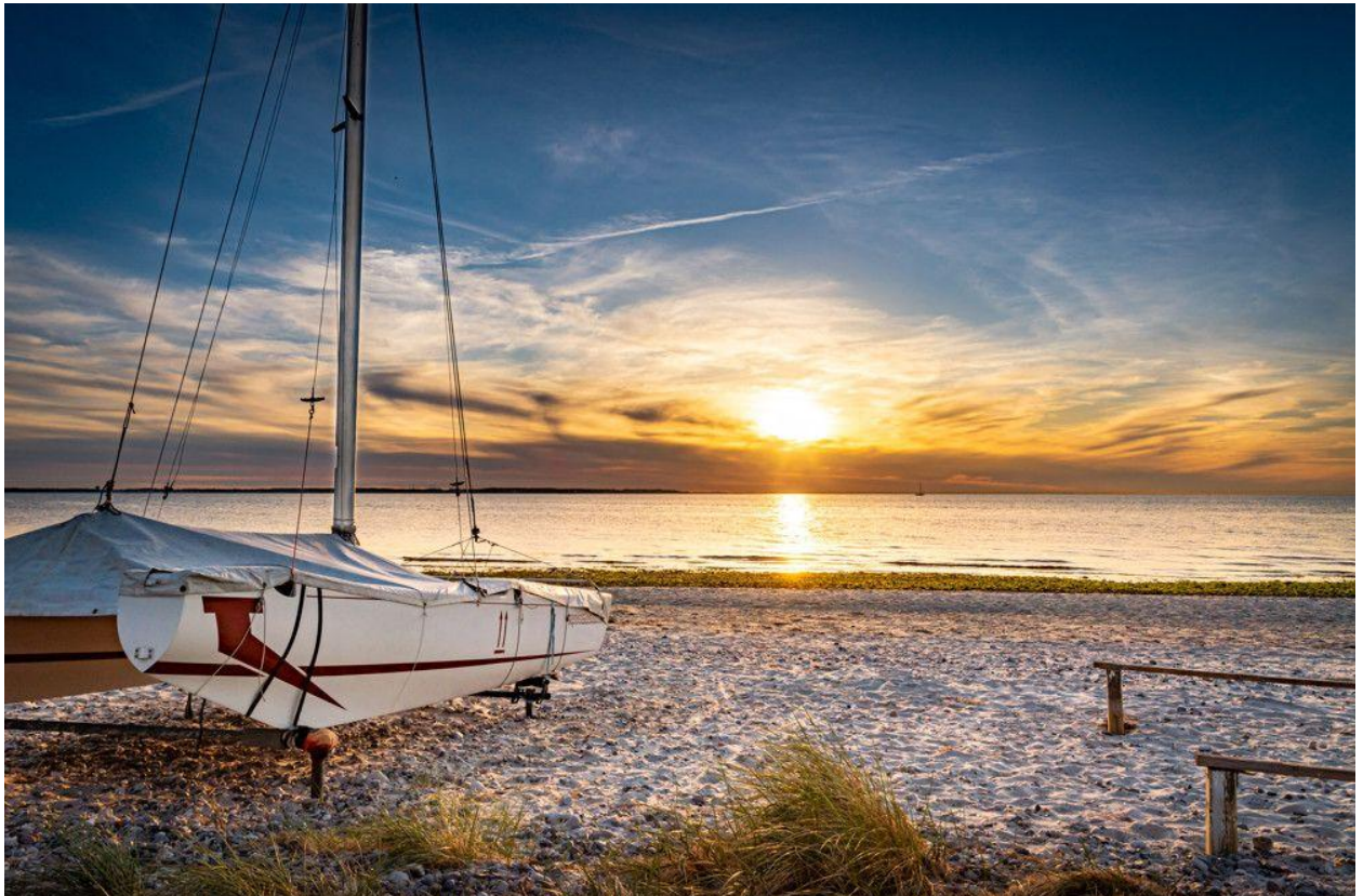
Abendstimmung am Strand