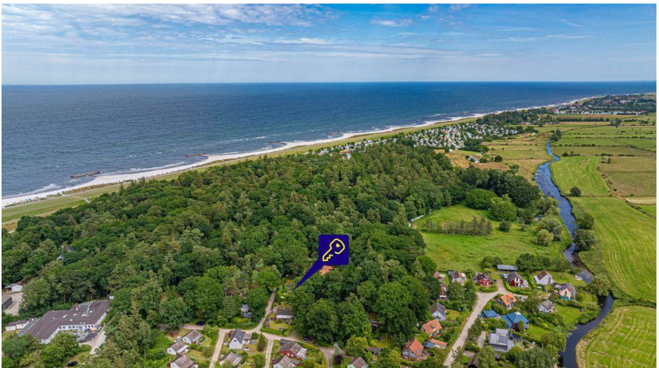
Der Ostsee so nah