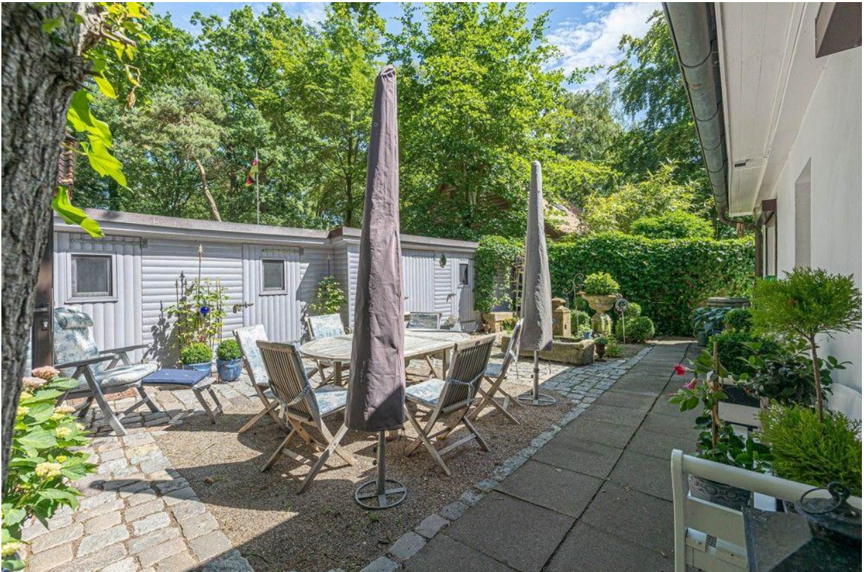
Nebengebäude mit viel Stauraum