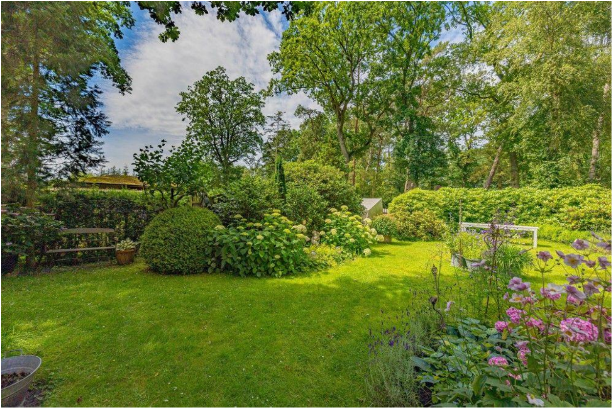
Von der Sonne verwöhnt