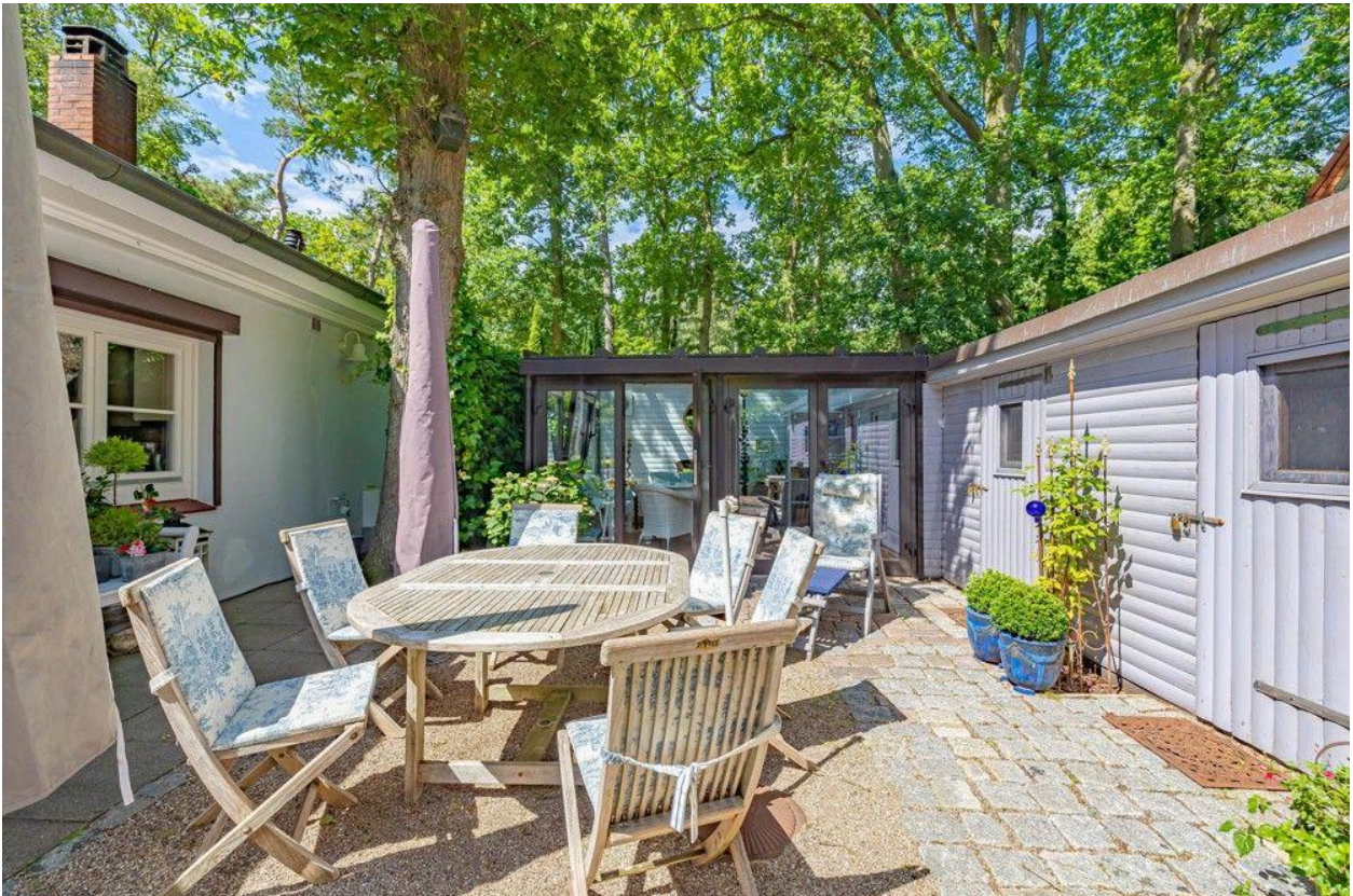
Mit separatem Wintergarten