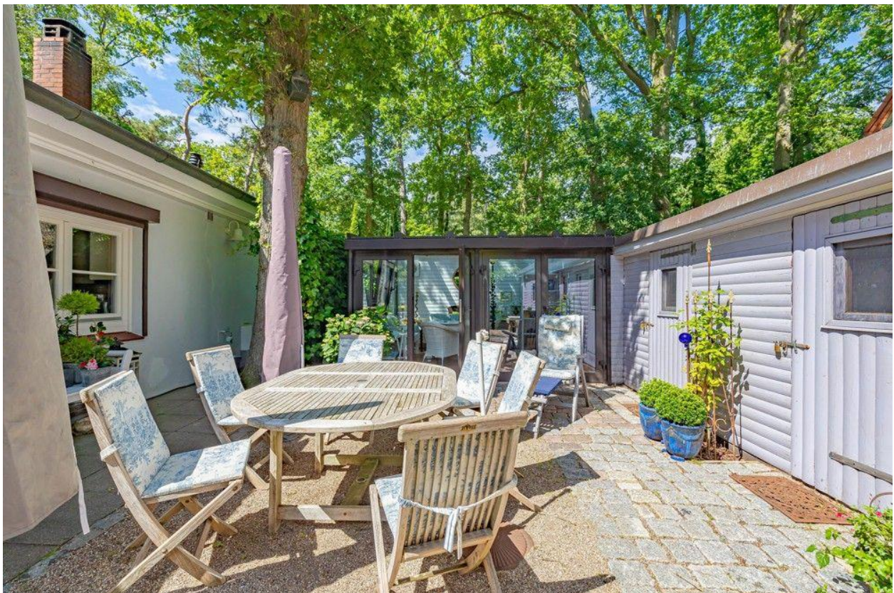
Mit separatem Wintergarten