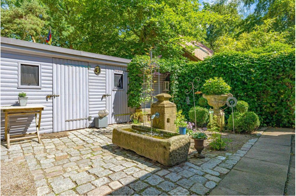
Ein Hingucker: Springbrunnen aus Naturstein