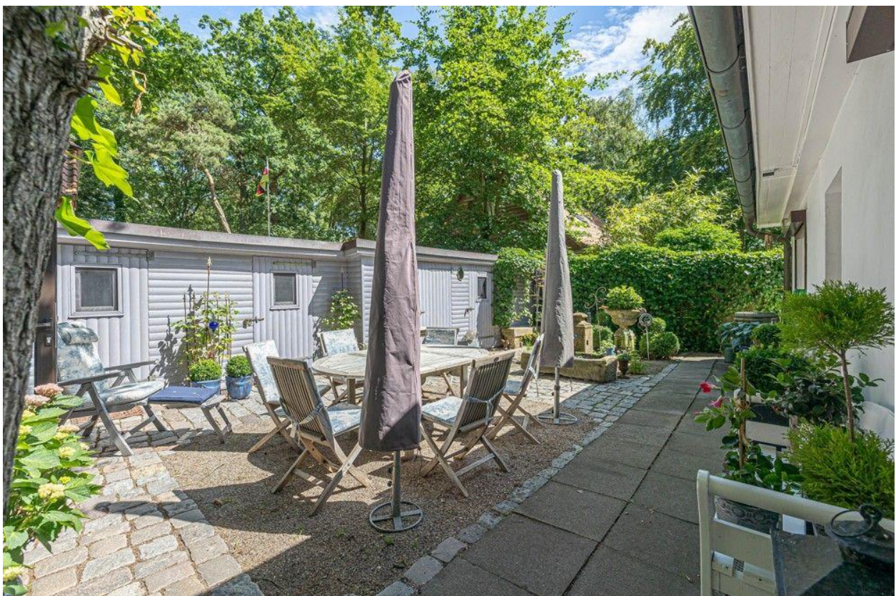
Nebengebäude mit viel Stauraum