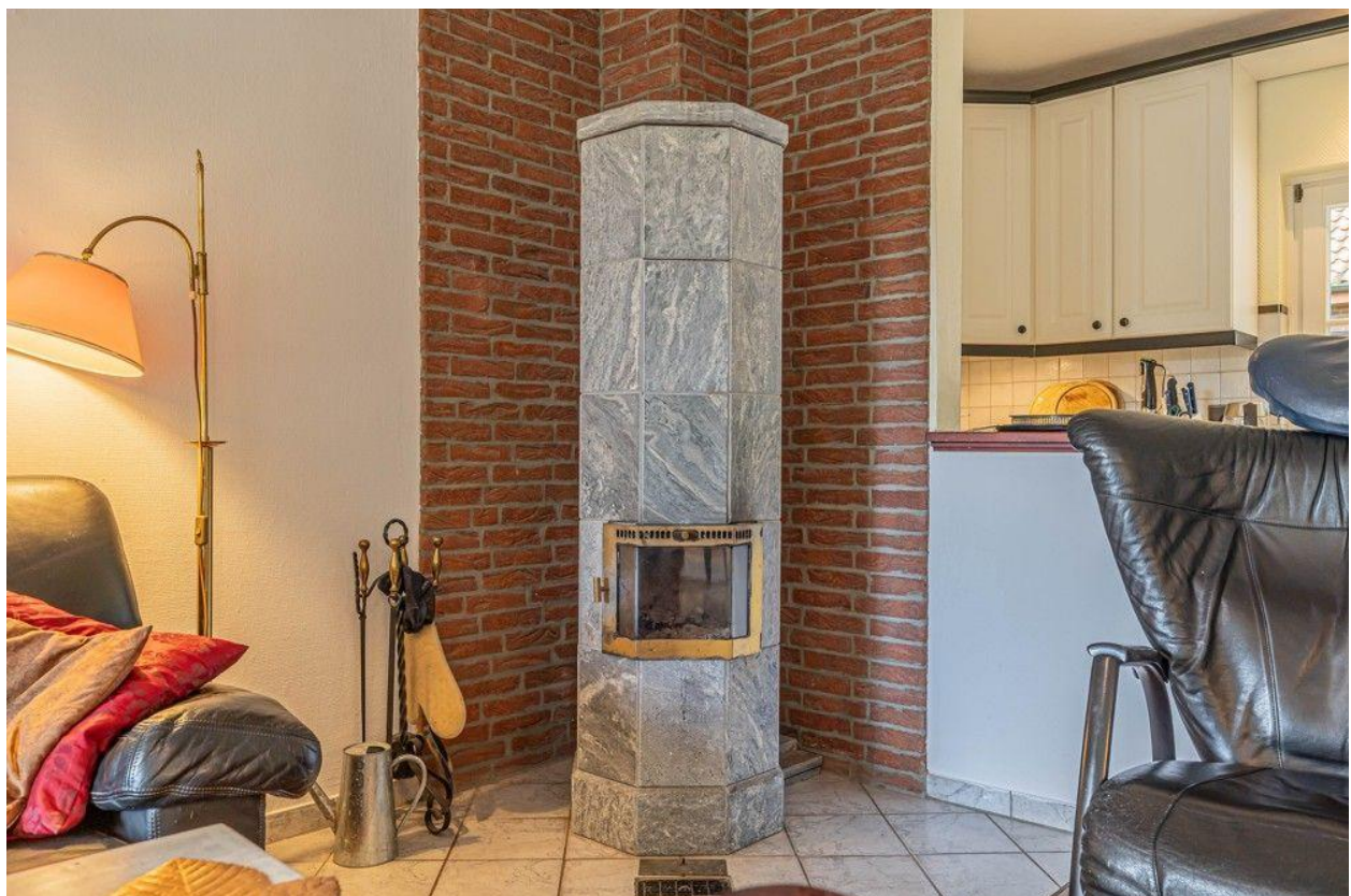
Gemütlichkeit am Specksteinofen