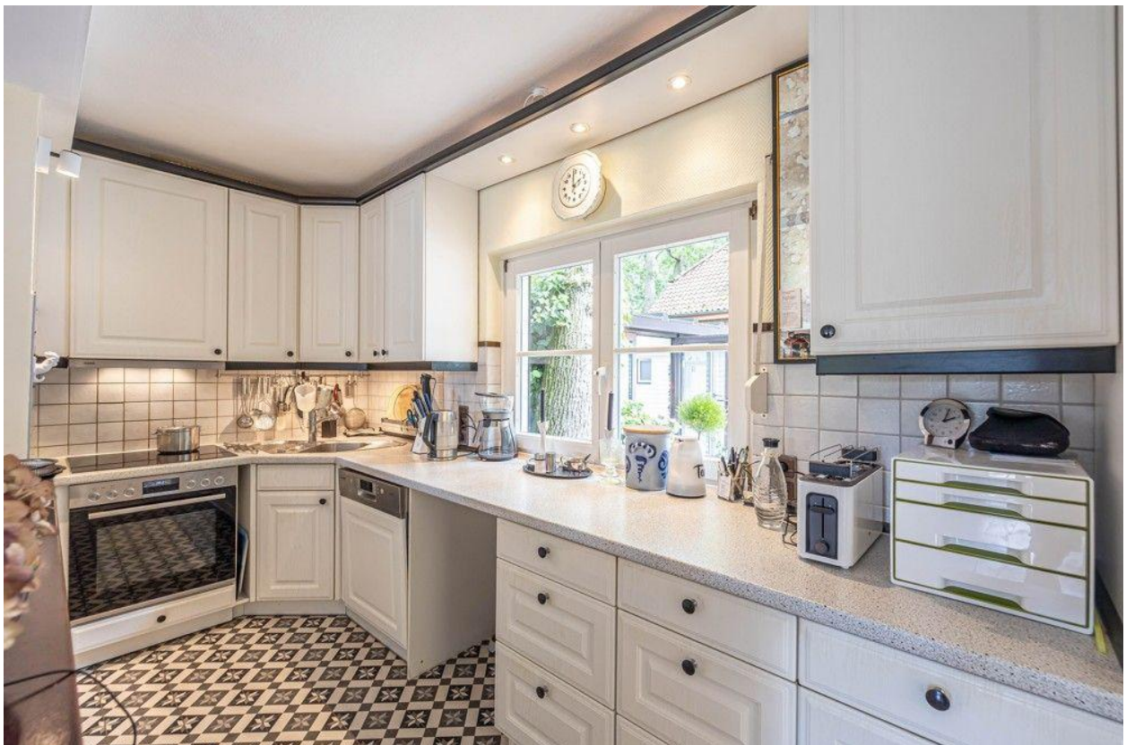
Die offene Küche