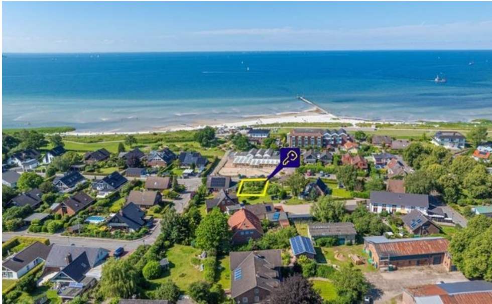
Traumgrundstück in Stein