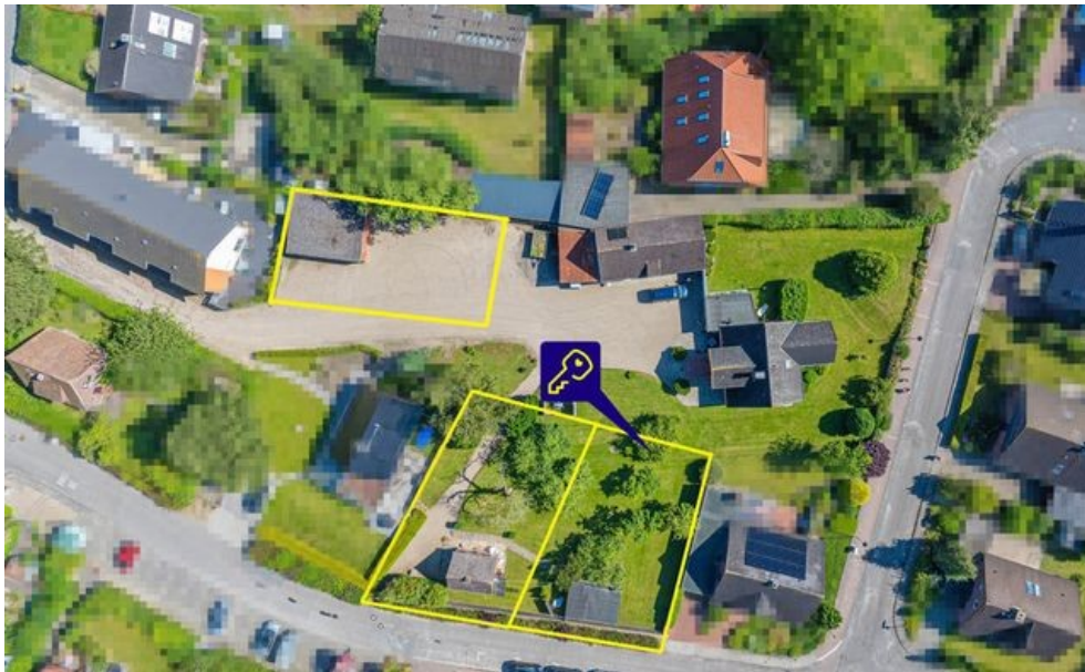
Grundstück und weitere Grundstücke (nicht maßstabsgetreu)