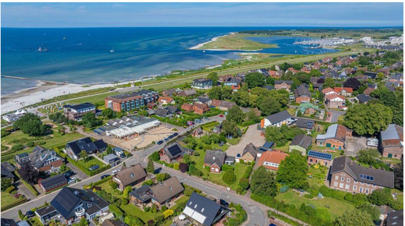
Ca. 250 Meter bis zum Strand