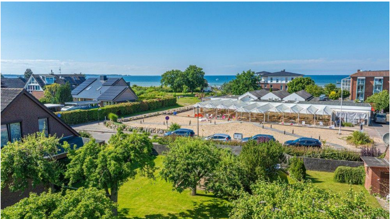
Blick aus ca. 8 Metern Höhe