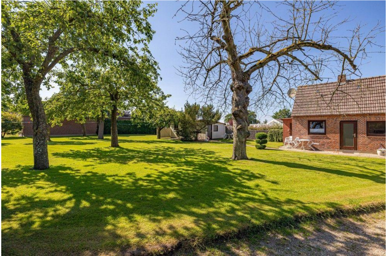
Blick vom Nachbargrundstück