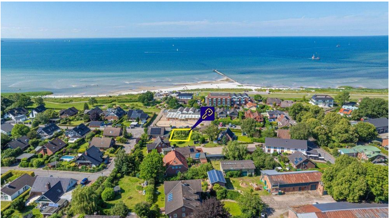
Traumgrundstück in Stein