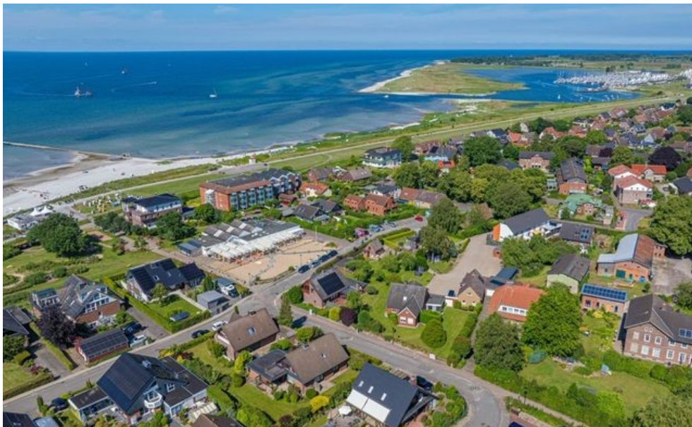
Ca. 250 Meter bis zum Strand