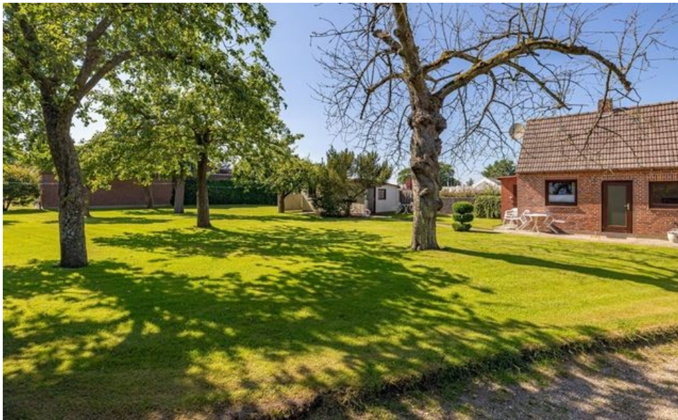
Blick vom Nachbargrundstück