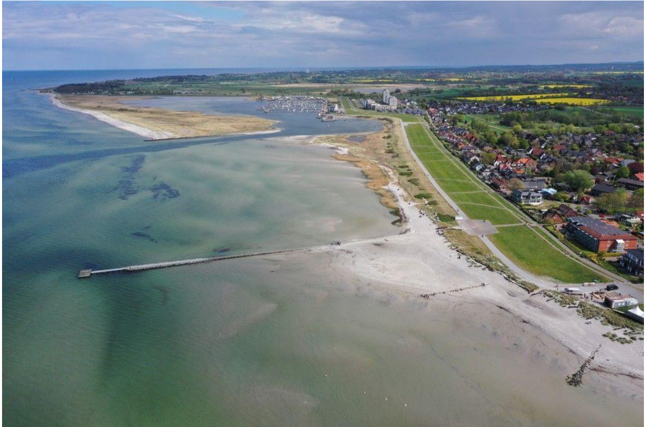
Steiner Strand und Marina Wendtorf