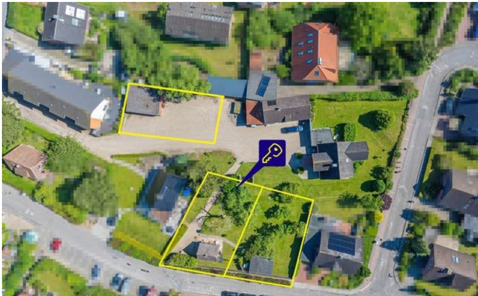
Grundstück und weitere Grundstücke (nicht maßstabsgetreu)