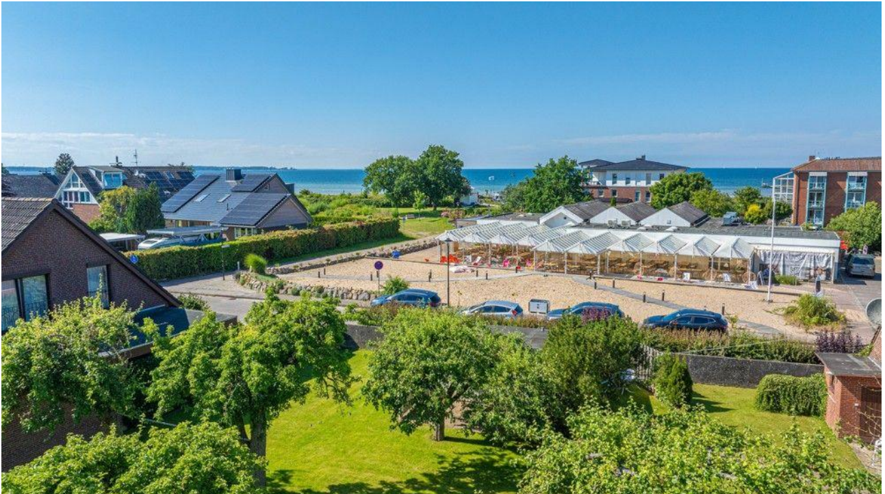
Blick aus ca. 8 Metern Höhe