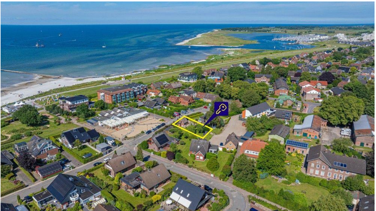
Wunderbares Grundstück in Stein