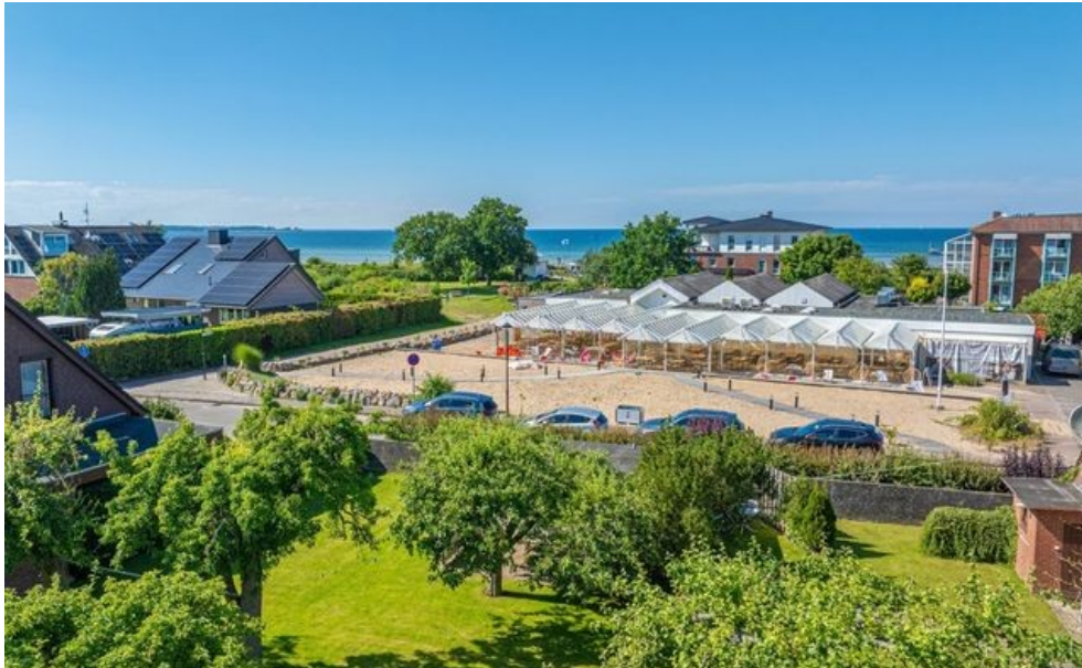
Blick aus ca. 8 Metern Höhe