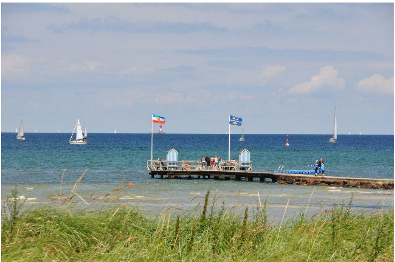
Bademole am Steiner Strand