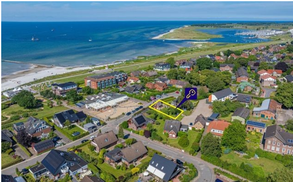
Wunderbares Grundstück in Stein