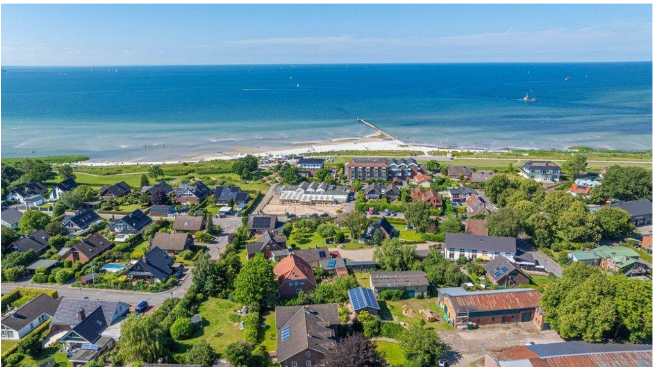
Ca. 250 Meter bis zum Strand