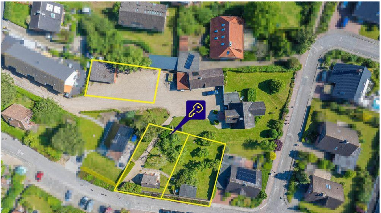
Grundstück und weitere Grundstücke (nicht maßstabsgetreu)