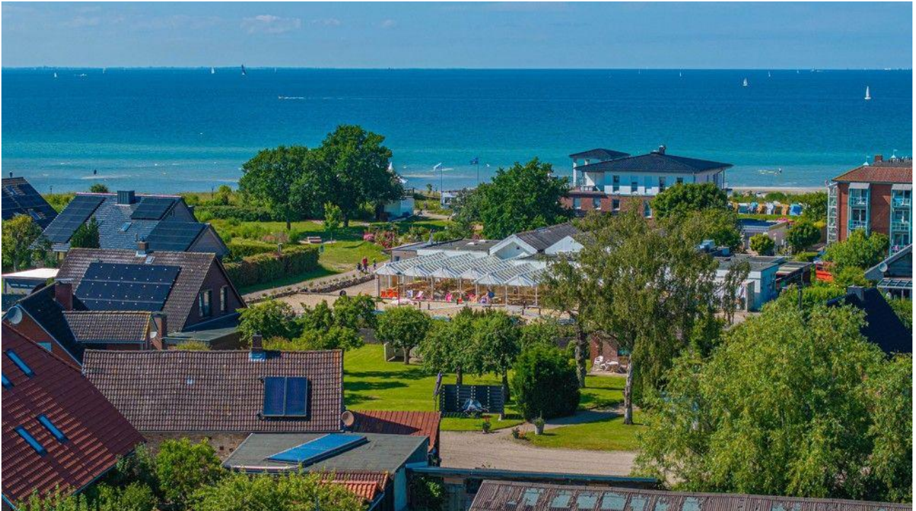
Aktueller Blick aus ca. 8 Metern Höhe