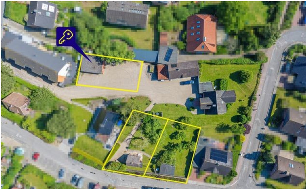
Grundstück und weitere Grundstücke (nicht maßstabsgetreu)