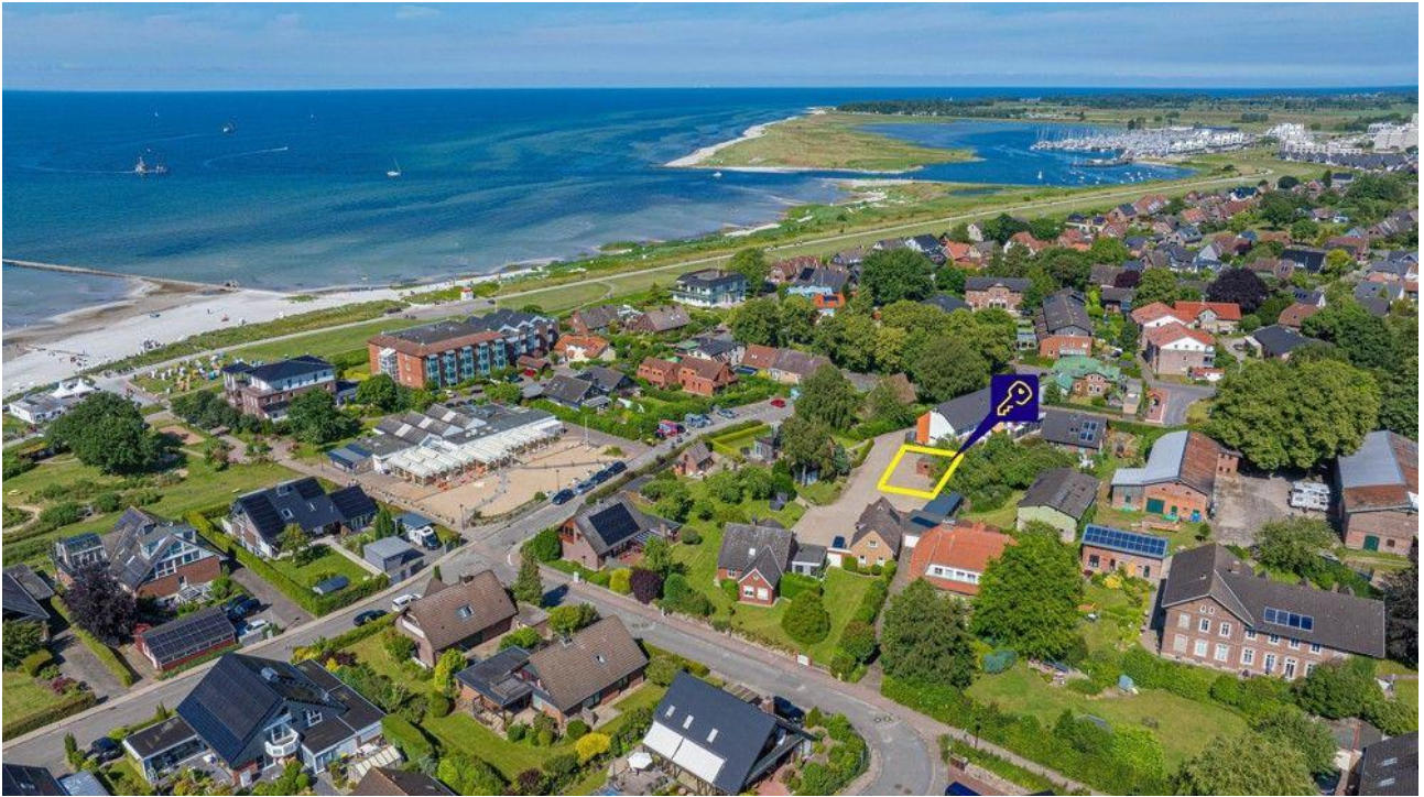
Wunderbares Grundstück in Stein