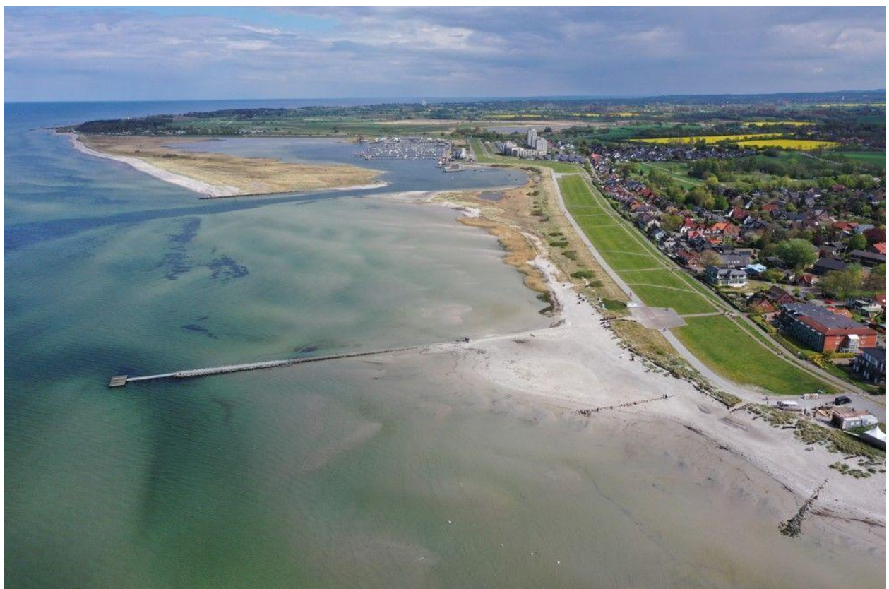
Steiner Strand und Marina Wendtorf