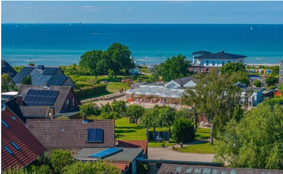
Aktueller Blick aus ca. 8 Metern Höhe