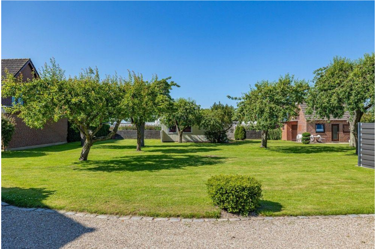
Blick auf die gegenüberliegenden Grundstücke