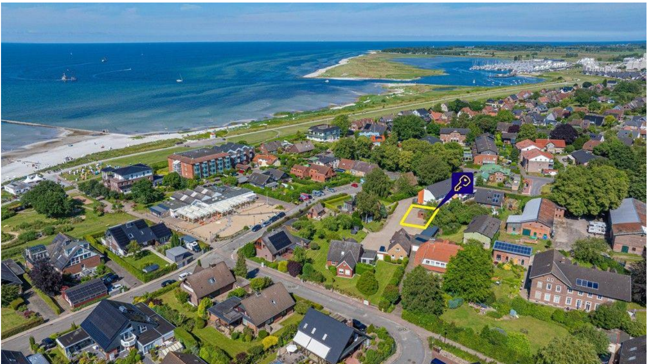
Wunderbares Grundstück in Stein