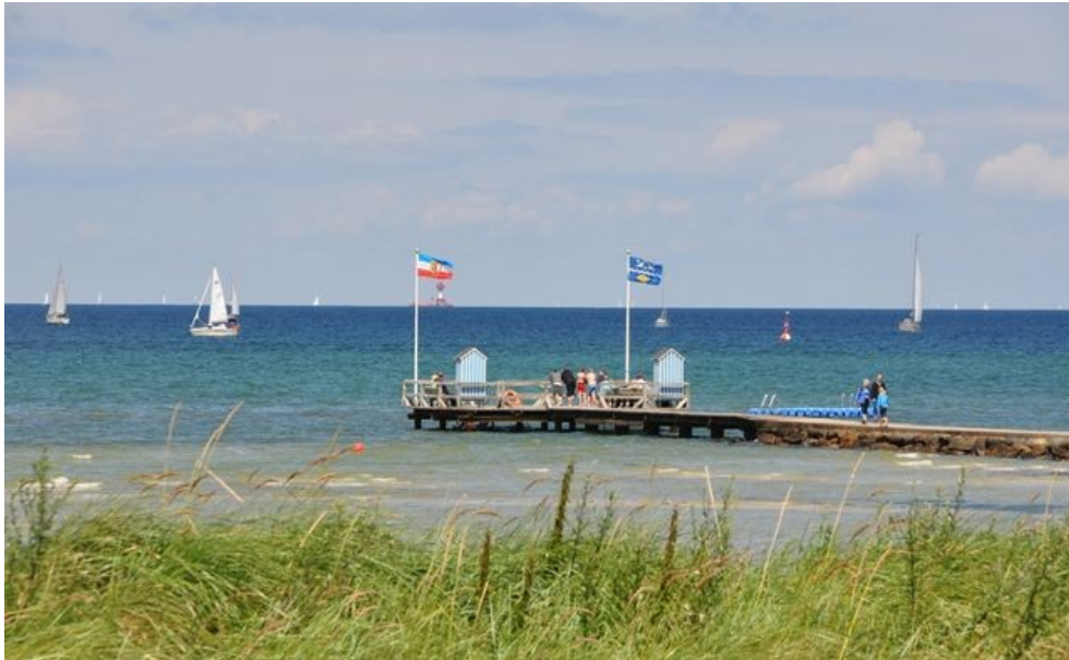
Bademole am Steiner Strand