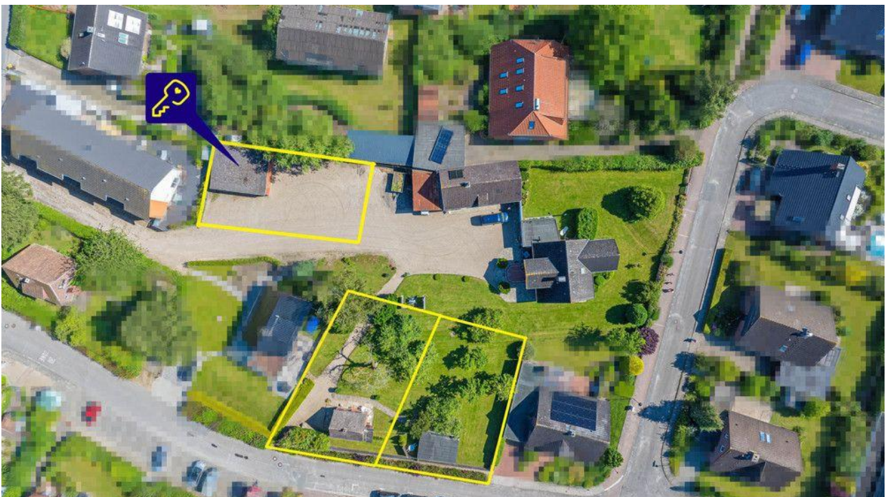
Grundstück und weitere Grundstücke (nicht maßstabsgetreu)