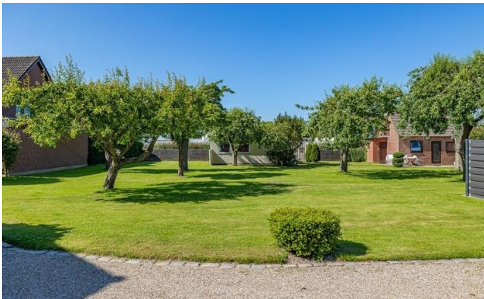
Blick auf die gegenüberliegenden Grundstücke