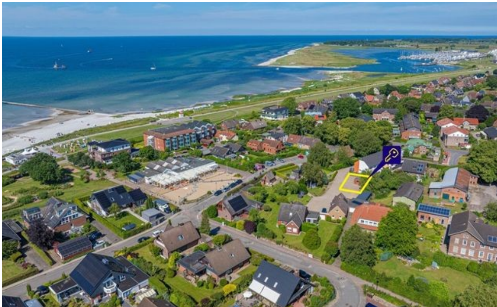
Wunderbares Grundstück in Stein