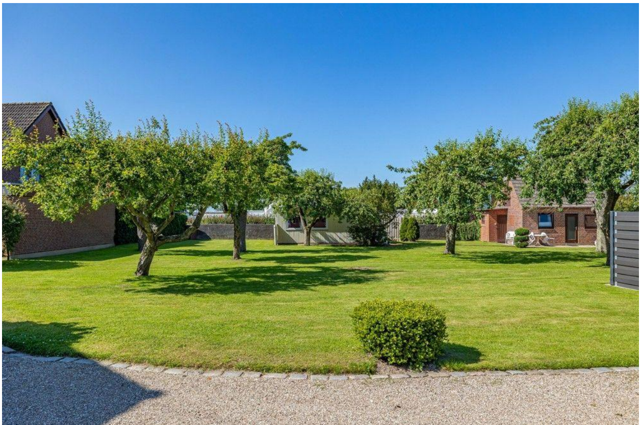
Blick auf die gegenüberliegenden Grundstücke