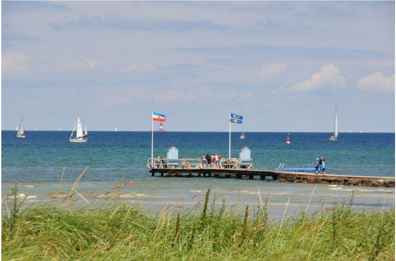
Bademole am Steiner Strand