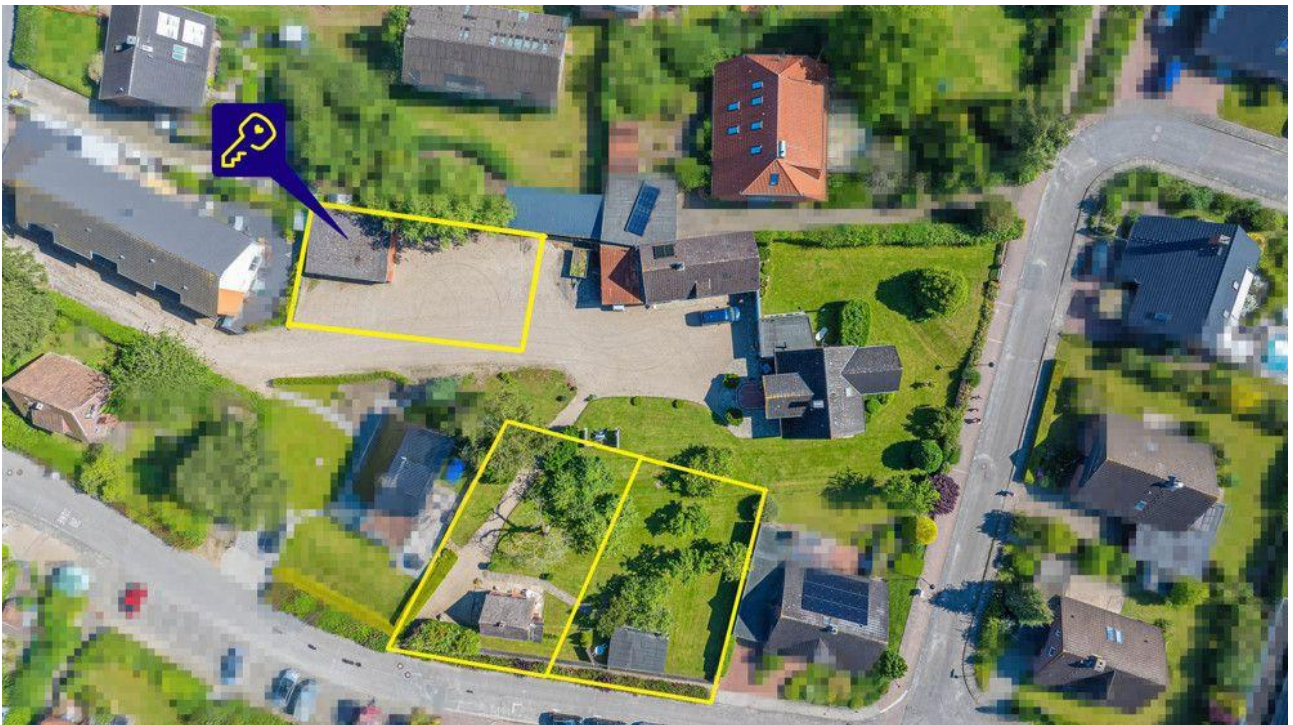
Grundstück und weitere Grundstücke (nicht maßstabsgetreu)