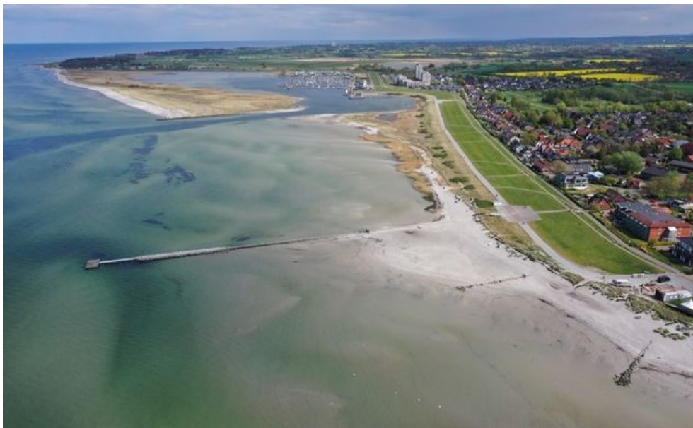
Steiner Strand und Marina Wendtorf