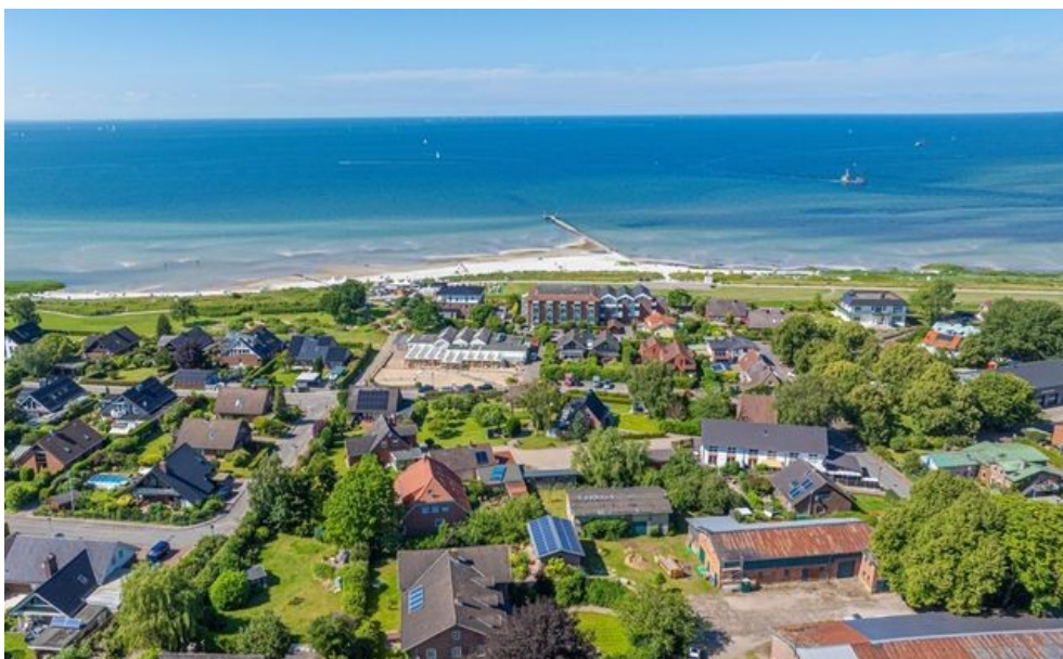
Ca. 250 Meter bis zum Strand