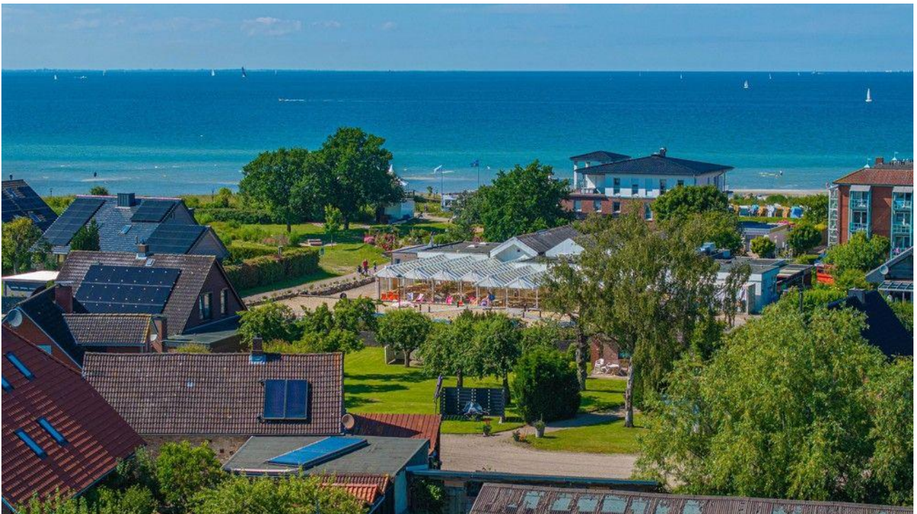
Aktueller Blick aus ca. 8 Metern Höhe