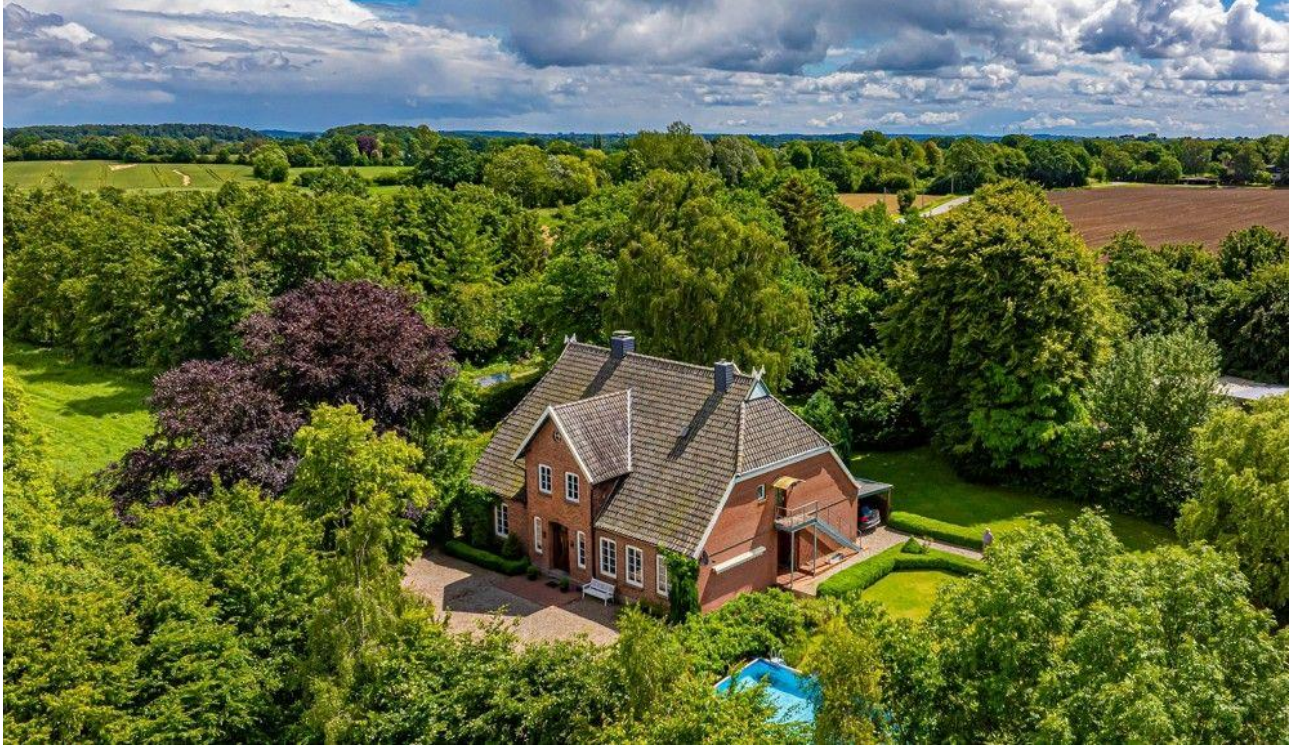
Ihr neues Zuhause