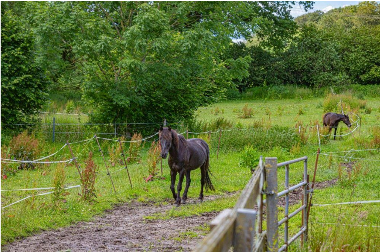
Pferde am Haus