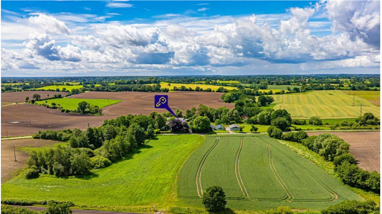
Land am Hof