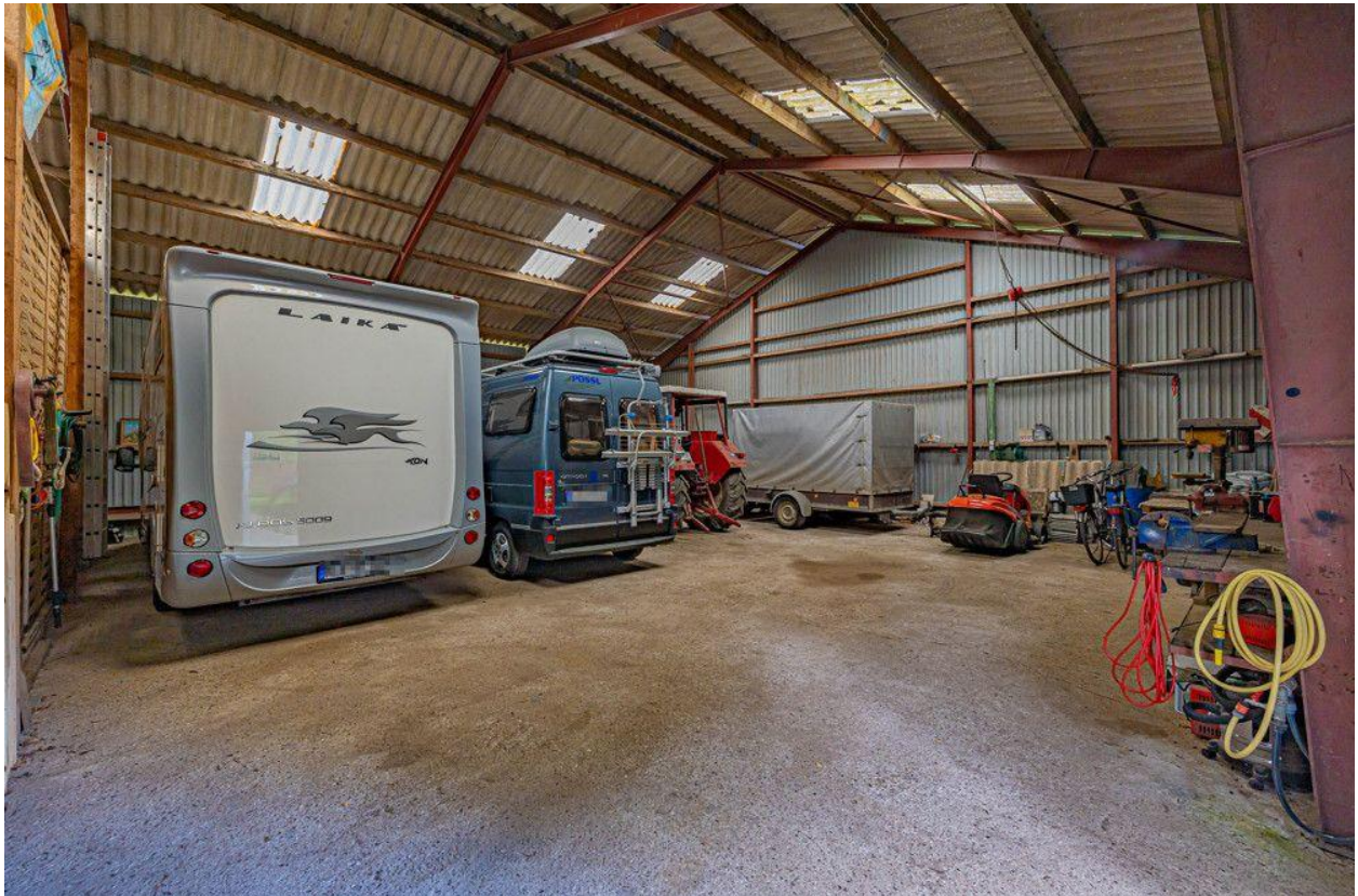
25m x 20m