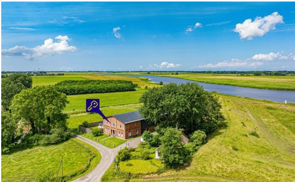
An der Eider gelegen