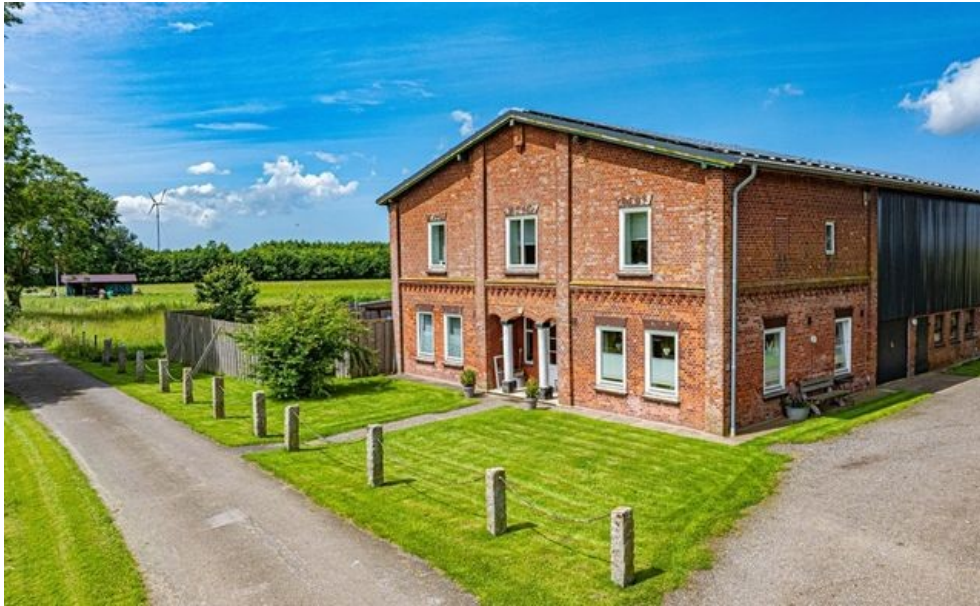
Ihr neues Zuhause