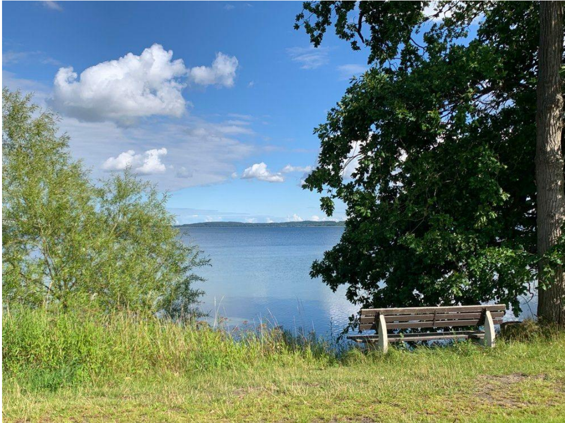
Der Selenter See ist nicht weit entfernt